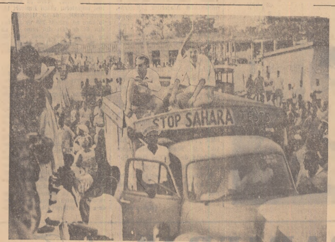
La Accra, capitala statului Ghana, au avut loc de curînd puternice demonstrații de protest împotriva intenției Franței de a face experiențe cu bomba atomică în Sahara. Imaginea de mai sus prezintă un aspect al unei asemenea demonstrații.

VIENTIANE. Agenția France Press a anunțat că Adunarea Națională a Laosului a hotărît la 19 decembrie să ridice imunitatea parlamentară a prietenului Suwong și alilor șefi deputați din partea partidului Neo-Lao-Hak-Sat. Această hotărîre a fost adoptată cu 33 de voturi pentru și 12 contra.