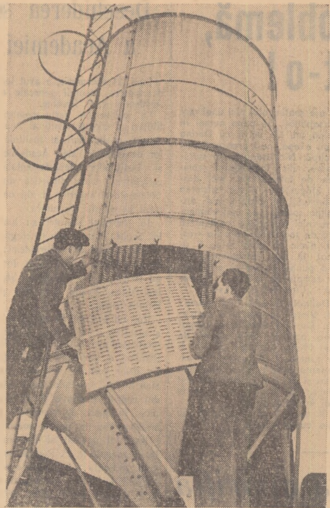
Uzina de mașini agricole Petkus din Wutha (R.D. Germană) produce printre altele silozuri tubulare perfecționate. Fotografia noastră reprezintă un asemenea siloz, care urmează să fie înaltă la o cooperativă agricolă de producție din R.D. Germană.

Comisia permanentă a examinat măsurile pentru ridicarea nivelului de eficiență a activității sale în domeniul colaborării economice și tehnico-științifice dintre țările membre ale C.A.E.R. în domeniul agriculturii. Au fost examinate problemele îmbunătățirii continue a activității Colegiului redacțional al „Revistei agricole internaționale” și a fost aprobat planul de muncă al Comisiei pe anul 1960.