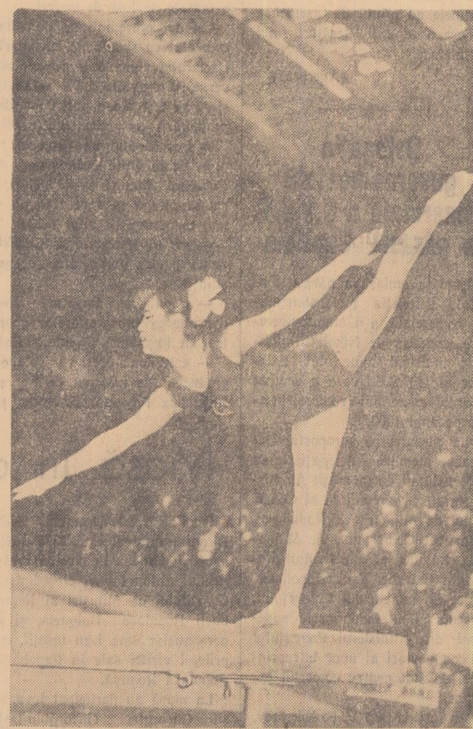
Evoluția gimnastelor chineze la birnă a impresionat prin siguranța cu care au executat exerciții dificile.