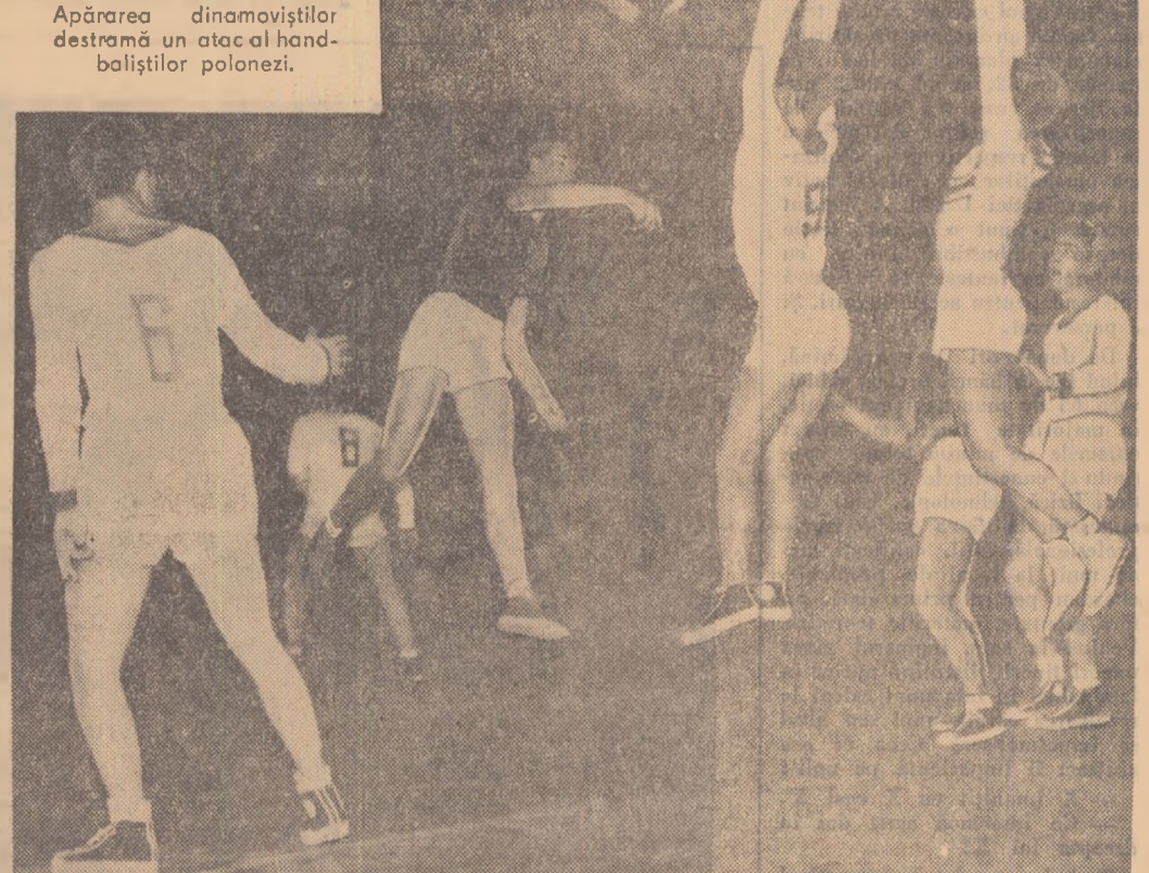
Apărarea dinamoviștilor destramă un atac al handbalistilor polonezi.