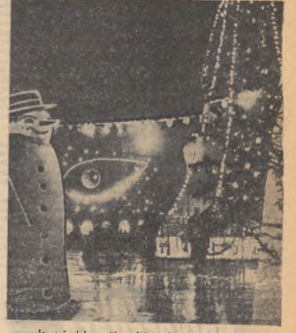
În orășelul copiilor din Piața Republicii