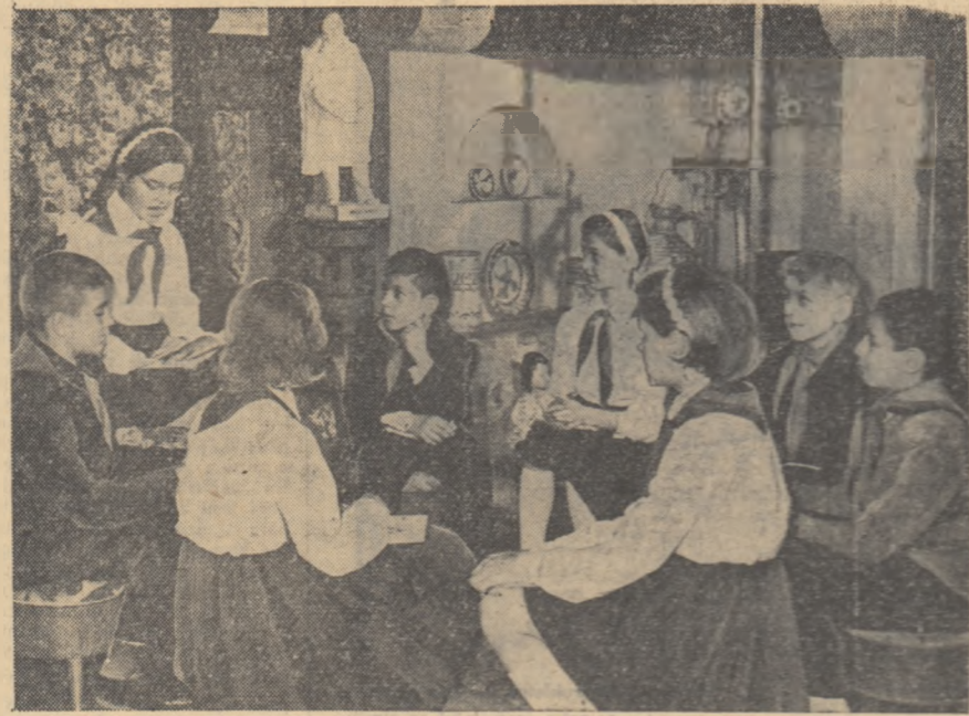
E vacanță: În camera de povești a Palatului Pionierilor din București s-a adunat un grup de pionieri.

Sîntem conștienți că angajamentele noastre vor fi concretizate în spectacole de amatori la un nivel artistic cit mai înalt. ADUNAREA GENERALĂ A ORGANIZAȚIEI DE BAZA U.T.M. DE LA TEATRUL DE STAT DIN TIMIȘOARA