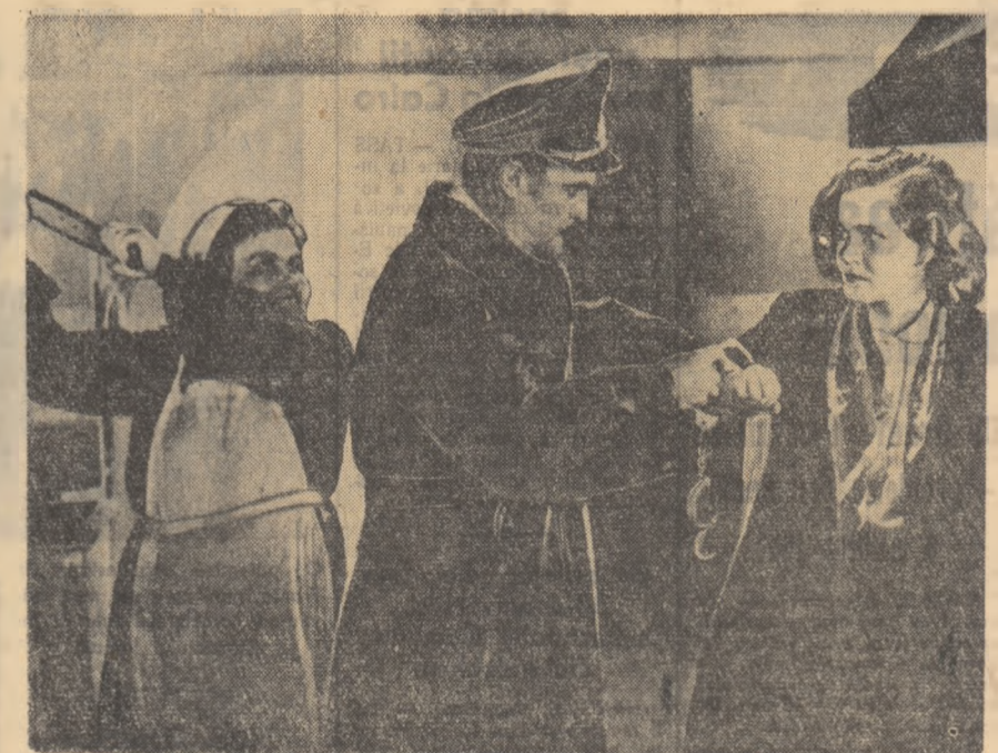
Letă o scenă din noul film sovietic: „Ceasul s-a oprit la miezul nopții” care va rula în curînd pe ecranele Capitalei.

Pe baza discuțiilor și a propunerilor făcute de participanți, adunarea a adoptat o seamă de măsuri menite să ridice nivelul vieții de organizație. Participanții la adunarea de alegeri și-au exprimat convingerea că sub conducerea organizației de partid și cu sprijin în viața mîsurile adoptate, vor putea să îmbunătățească activitatea organizației de bază U.T.M. din gospodăria colectivă. I. ANDREI