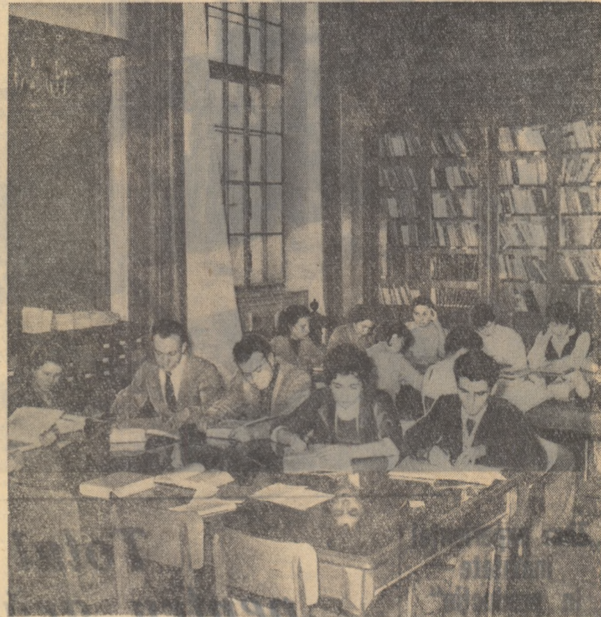
Vin examenul! Biblioteca sînt viu solicitată. Orice clipă liberă e prețioasă pentru repetarea materiei.