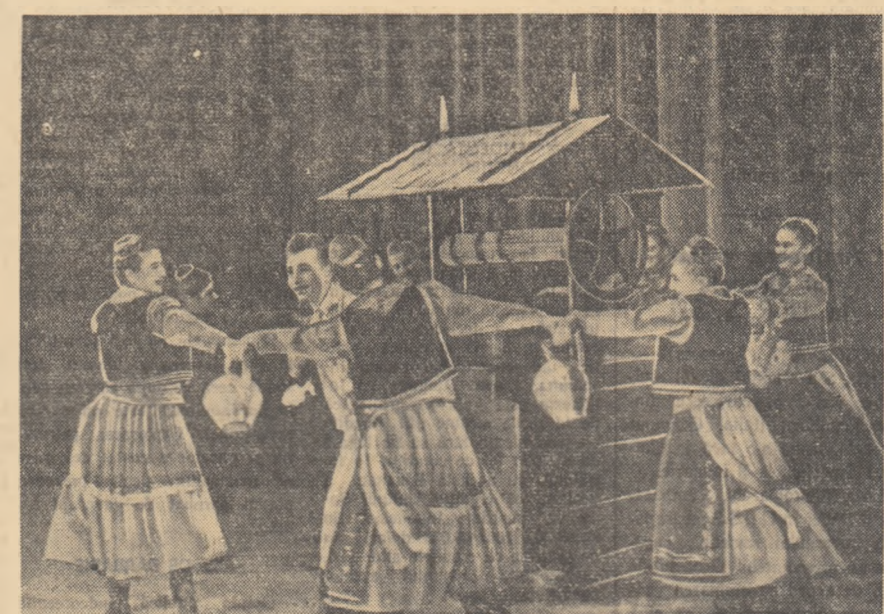
Formația de dansuri a întreprinderii „Unio” Satu Mare. În fotografie: un aspect din timpul executării unui dans popular.