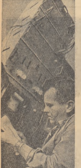
Calculatorul statistic, una din ultimele mașini matematice cehoslovace rezolvă multe din problemele mișcării browniene.

— Astăzi se folosește pe scară întinsă esofagoplastia cu