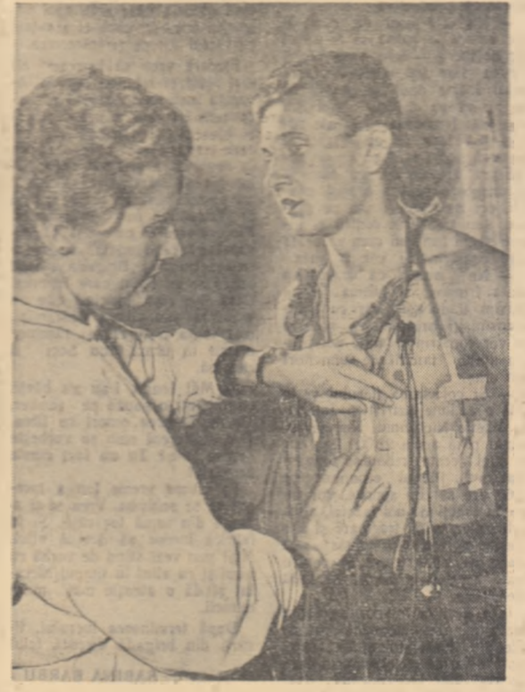
Scurte consultații pentru pregătirea unui viitor zbor cosmic.

Un grup de ingineri din Krasnoarsk a elaborat un sistem de