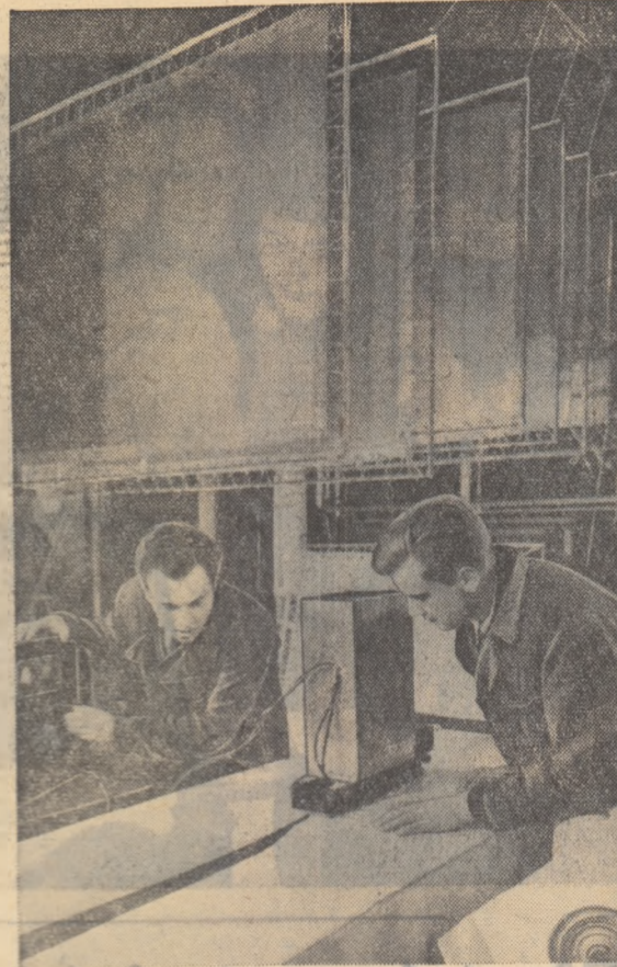
Inginerii sovietici lucrînd la construirea unor ecrane de masă plastice.