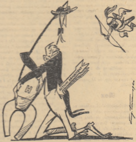
CINE SE OPUNE DEZARMĂRII TRUSTMANUL: — Cum să te parădesc, comara mea, cînd am fost săgetat în inimă? ! Desen de EUG. TARU

BERLIN 9 (Agerpres). — eșara zilei de 8 ianuarie în E linul occidental a avut loc mare demonstrație de protest împotriva provocărilor fasciste continuă în Germania Occidentală. La demonstrație au l parte câteva zeci de mii de ț soane printre care membri organizatorilor de tineret „Soim Uniunea socialistă a studenților germani”. „Prieteni nату și alții. Demonstrații au tre pe străzile Berlinului occidental purtînd pancarte pe care scria: „Jos naziiștii”. „Să pună capăt provocărilor fasciste”, „Sîntem împotriva antisemitismului și alțiilor vrăjbiți de popoare”. Mii de locuitori Berlinului occidental au salt pe demonstrații.