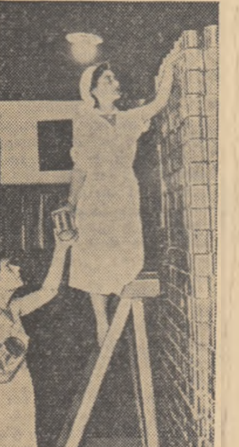
Zilnic de la Fabrica „Fructonil” din orașul Giurgiu pleacă spre consumatori importante cantități de conserve și computuri.