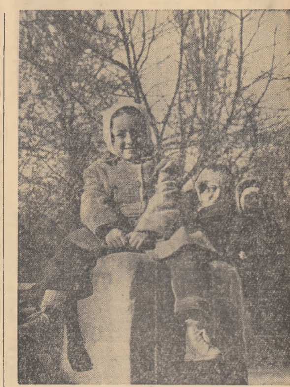
În locul nămeților lui ianuar, soare, uscat și... firește, joacă.