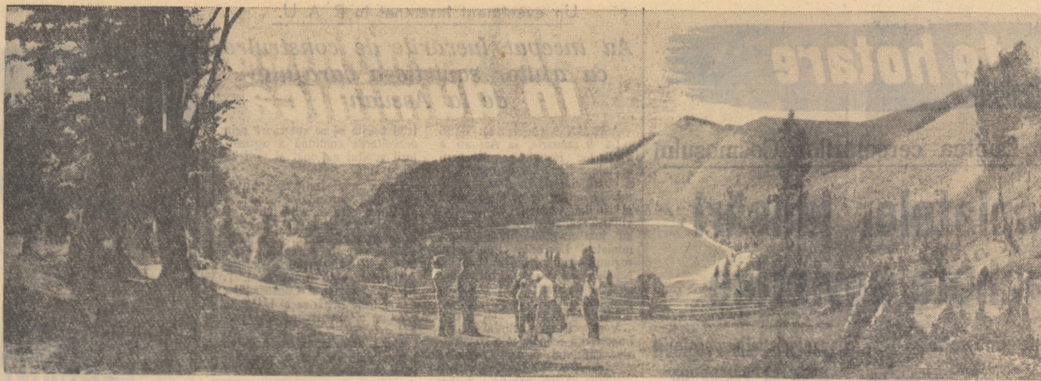
Din frumusețile patriei: Lacul Sf. Ana.