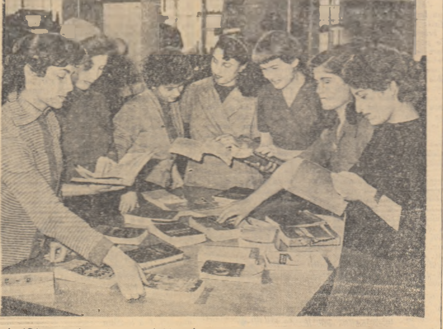
La biblioteca voluntară din sectorul IV al Întreprinderii textile „Tricotajul Roșu” din Capitală au sosit cărți noi.