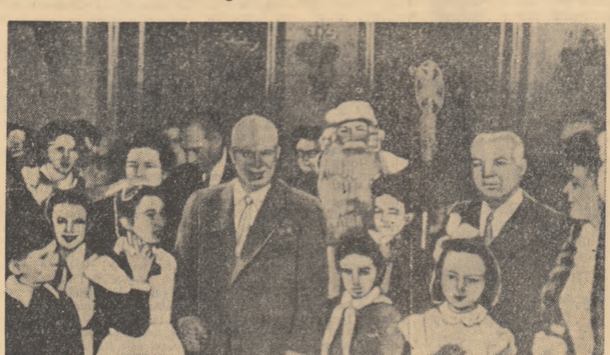
De curînd, N. S. Hrușciov și K. E. Vorosilov au fost oaspeții copiii, la pomul de iarnă care a avut loc în Palatul Mare al Kremlinului.

GENEVA 12 (Agerpres). — La 12 ianuarie s-a reluat lucrările la Geneva conferința celor trei puteri U.R.S.S., S.U.A. și Anglia în problema încetării experiențelor cu arme nucleare.