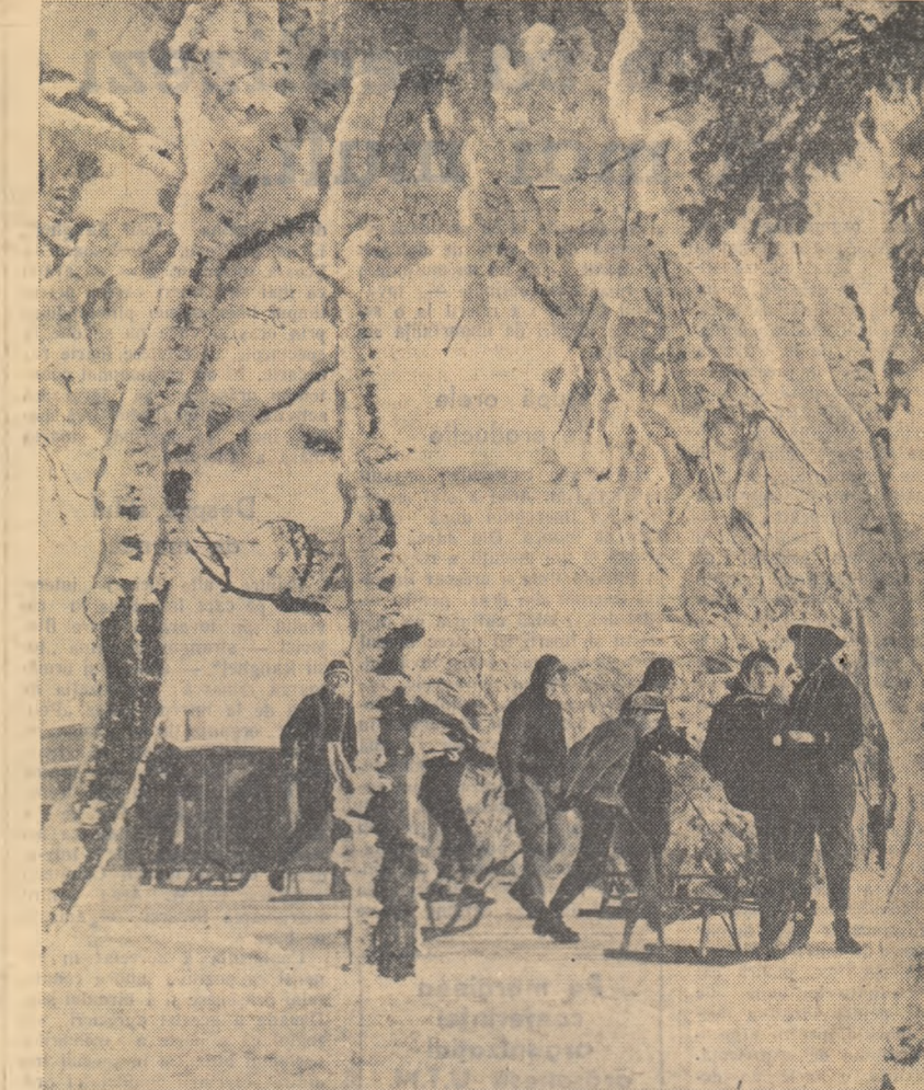
Stațiunile de odihnă din munții Erz (R. D. Germania) cunosc și în timpul iernii o afluență deosebită.

În momentul de față se aplică o nouă hotărîre a Consiliului Central al Sindicatelor și a C.C. al U.T.S., care se referă la decernarea titlului de „Brigadă de muncă socialistă”, brigăzilor frunțate. Acastă formă de întrecere este considerată superioară, deoarece acum se în consideră nu numai cantitatea dar și calitatea producției, ridicarea calificării profesionale la un nivel mai înalt, activitatea pe tîrîm social, comportarea în societate. La această formă de întrecere socialistă participă pînă în prezent 806 de brigăzi din orșele Katowice, Opole, Poznan, Szczecin, Lodz. În curînd va avea loc decernarea de diplome, medalii, insigne și a titlului de „Brigadă de muncă socialistă” celor mai bune brigăzi de tineret.