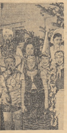
La „Carnavalul pionierilor” din Cluj.