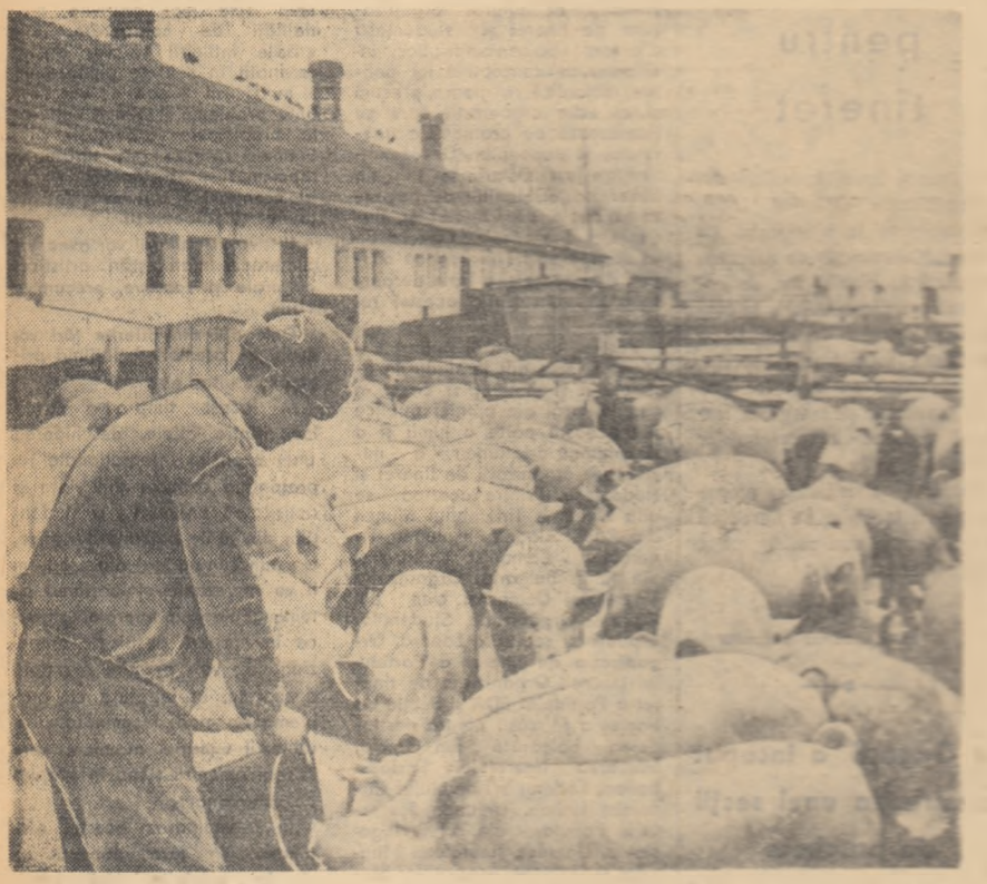
Gospodăria de stat Căzănești este o mare unitate socialistă producătoare de carne. Tinerii îngrijitori de aici, organizați în brigăzi, și-au însușit bine meseria aceasta și se ocupă permanent de sporirea producției și reducerea pierderii de carne.

Această situație nu mai putea dăinui. După apariția documentelor Plenarei C.G. al P.M.R. din 3—5 decembrie 1959, după studierea lor temeinică, organizația de partid și conducerea gospodăriei colective au trecut la o serie de măsuri practice, menite să îmbunătățească munca în sectorul zootehnic. Primind sarcină din partea organizației