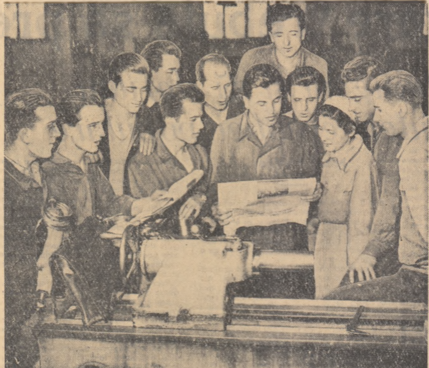
Un grup de tineri de la Atelierele C.F.R. „Grivița Roșie” citind raportul tovarășului N. S. Hrușciou la sesiunea Sovietetului Suprem al U.R.S.S.: „Dezarmarea — calea spre consolidarea păcii și asigurarea prieteniei între popoare.”