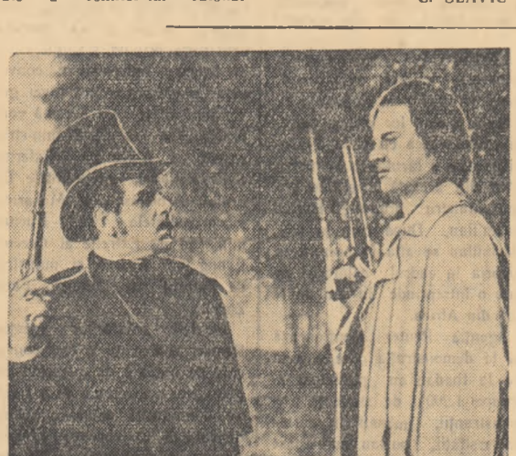
Scenă din filmul „Părinți și copii”