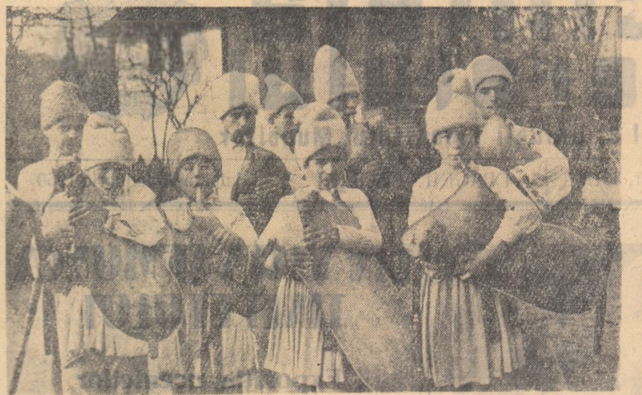
Echipa de cîmpieri a cîminului cultural din comuna Bătrîni, regiunea Ploști.

Depinde doar de noi să știm să strîngem diamantele împrăștiate, să le adunăm și să le șlefuiim ca să le întoarcem apoi poporului însuși.