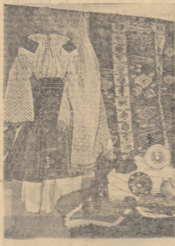
Un buchet din ființele artei populare.

Cercetarea și valorificarea pe un plan larg a creației populare din regiune va duce la îmbogățirea datelor ce se cunosc în legătură cu aceste creații, la o cunoaștere mai profundă a izvoarelor lor istorice în care se reflectă condițiile de muncă și de viață din trecut și de azi ale oamenilor muncii. Acțiunea va contribui la educația patriotică a tineretului.