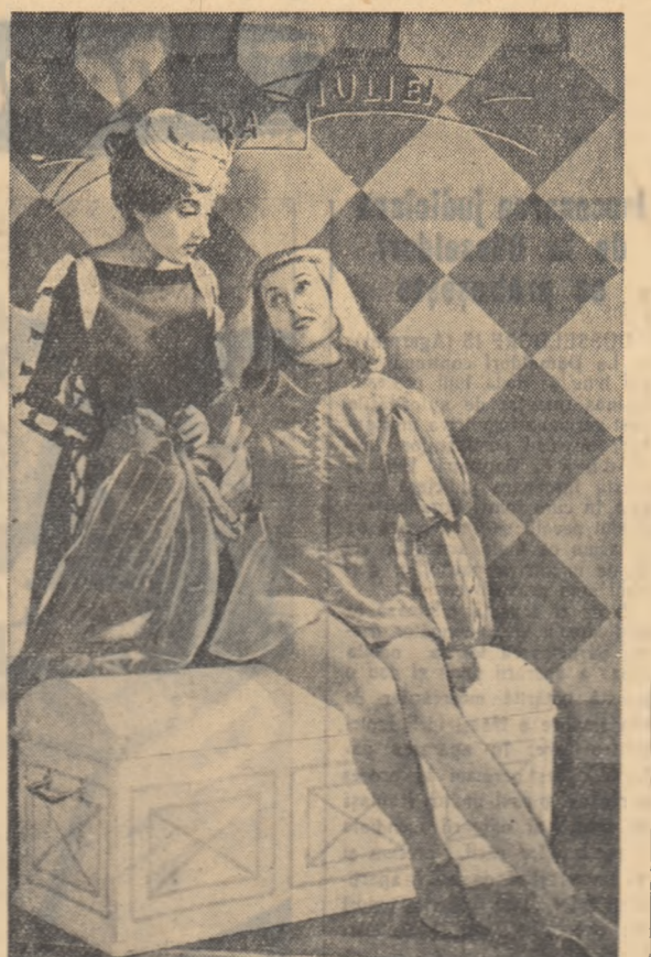
Scenă din piesa „Doi tineri din Verona” de William Shakespeare din curînd la Teatrul C.F.R. Giulești

— Ședința activului de la școlii din Șchitu Duca