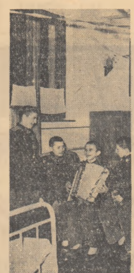
Seara, la cîmînul de ucenici al școlii profesionale a Uzinelor „Steagul Roșu” din Orașul Stalin