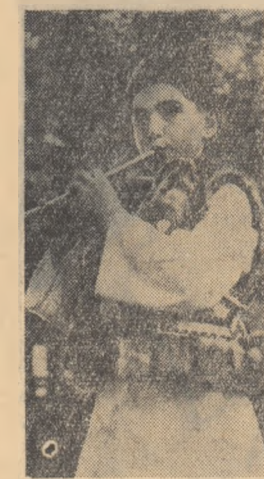
Tînră fluteraș din comuna Sadeva, regiunea Suceava.

Noi toți și organizațiile de tineret se cîntec să acordăm o deosebită atenție culegătorilor și creatorilor populari tineri, care dovedesc un deosebit talent și care preiau moștenirea stăruitorilor, cîntăreților, cîmpitorilor bătrîni din satele noastre. În cursul acestui an Casa Centrală de Creație Populară și Institutul de folclor vor organiza un concurs pe țară pentru crearea de cîntec populare noi și pentru culegerea cîntecelor muncitorești de luptă. Acest concurs va oferi organizațiilor de tineret un minunat prilej de a se preocupa de culegerea și valorificarea folclorului contemporan și de activitatea tinerilor creatori de artă populară. În orice caz toate aceste acțiuni, și cele existente și cele ce se vor organiza de acum înainte, pentru a fi cu adevărat folositoare fauririi culturii noastre socialiste, trebuie să fie organizate și desfășurate cu mult temei. Institutul de folclor îl revina aici sarcina de a contribui cu îndrumare științifică la cit mai buna lor desfășurare și el este gata să dea orînd această îndrumare în speranța că acțiunile întreprinse pînă acum de organizațiile de tineret se vor generaliza și vom izbîvi să avem în toate colțurile țării cit mai mulți tineri ce iubesc, prețuiesc, culeg, valorifică și creează bogățiile neprețuite ale folclorului nostru.