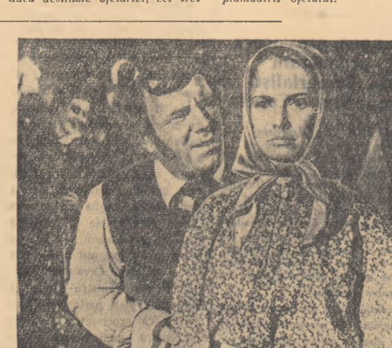
Scenă din filmul „Mumu”