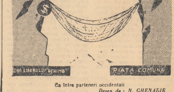
Ca între parteneri occidentali. Desen de N. GHENADIE

După cum transmite agenția United Press International, între guvernul englez și conducătorii Ciprului există serioase divergențe în legătură cu cererile britanice pentru ocuparea unei importante suprafețe din teritoriul insulei pe care vor fi instalate bazele militare precum și a menținerii suveranității engleze pe aceste teritorii. Ziarul cipriot de limbă greacă „Eleftheria” a scris în legătură cu aceasta, că încercînd să exercite conducerea politică și controlul în zonele ocupate de bazele din Cipru, englezii se străduiesc să facă din cipriotti „slavi la fel cum sînt cei din Hongkong”.