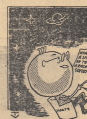
— Zburat cu această mare precizie a sistemului de teleghidare, trebuie să îi pregătiți: nu se știe când pot pica mustrările!

Ziarul „Daily News” reproducе declarația ministrului de Ra zboi al S.U.A., Gates, care a declarat că racheta sovietică „are un sistem de ghidare al dracului de bun”. Într-un comunicat al agenției Associated Press publicat în „New York Mirror” se subliniază precizia cu care a căzut racheta sovietică.