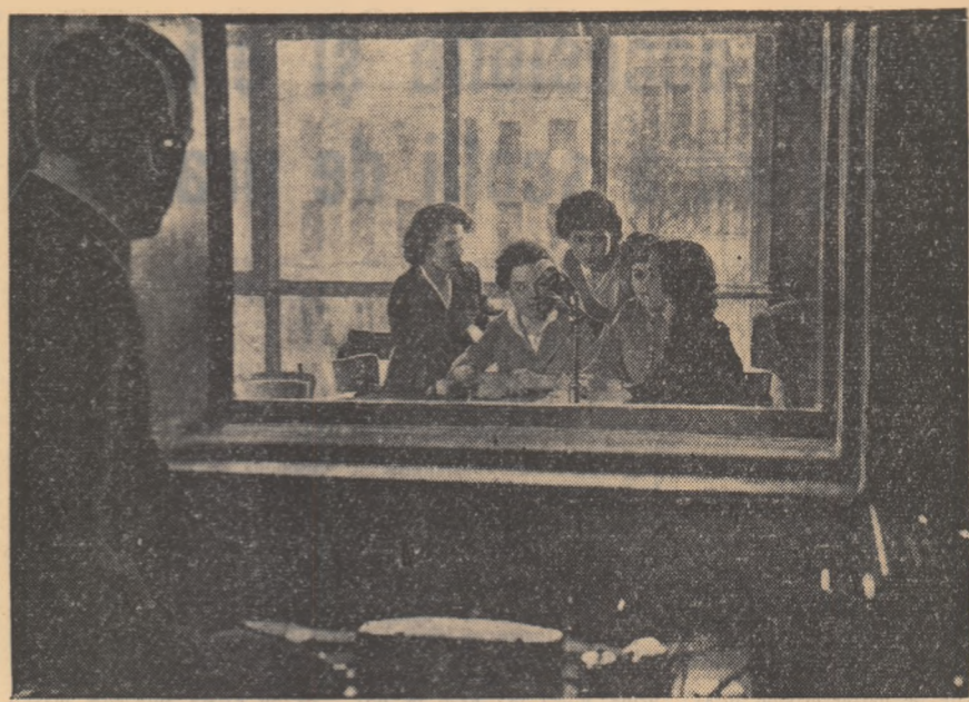
La Filatura de lînă plepătătoare din Moscova s-a înființat acum 2 ani o brigadă de tinere. Acum această brigadă a obținut înaltul titlu de „Brigadă de muncă comunistă”. Tinerele textileste și-au îndeplinit toate angajamentele luate în întrecerea socialistă. În fotografia: patru din membrele acestei brigăzi au fost invitate la studiul radiodifuziunii pentru a împărtăși din experiența muncii lor și altor tinere textileste.

La Frankfurt pe Main, în perioada dintre 10-18 ianuarie au avut loc 28 de manifestări hulgice fasciste, iar în regiunea Stuttgart — 20. Autoritățile orgenești, care sint vinovate că nu au măsurii pentru curmarea provocărilor fasciste, au declarat că numărul și caracterul acestor manifestări hulgice „nu sint alarmante”.