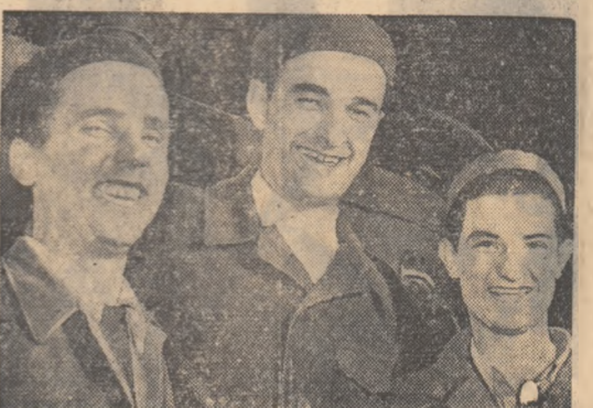
Proiectul a fost depus și după avizul celor competenți, aplicarea lui nu lasă loc la dubii. Un zîmbet volos și... o poză ca amintire a unei rodnice colaborări.