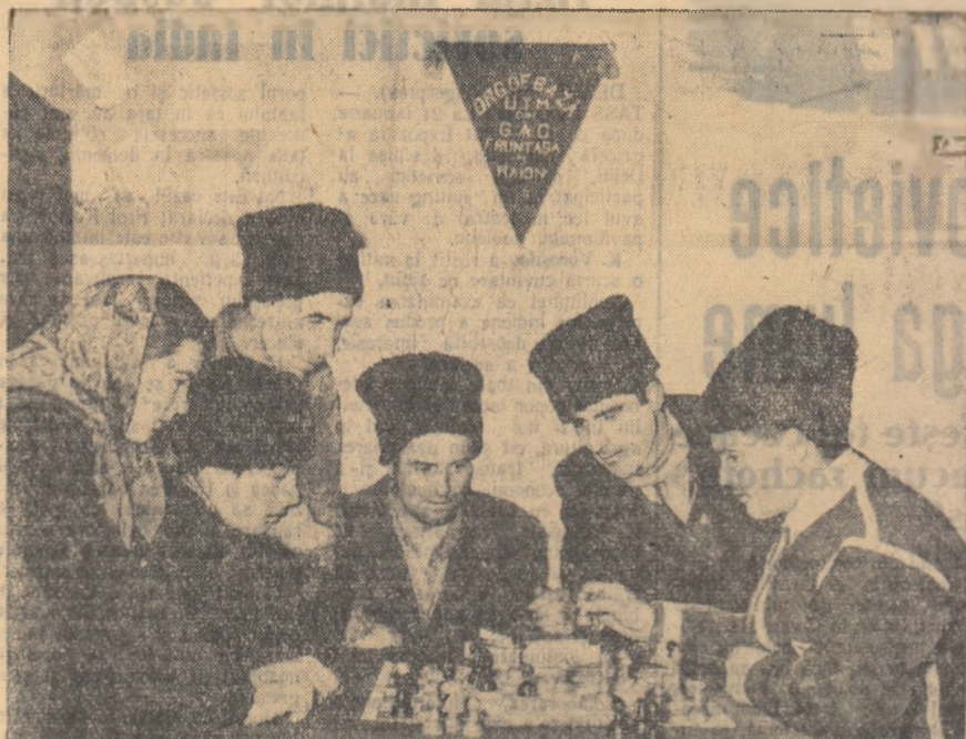
La colțul roșu al Gospodăriei agricole colective din comuna Pribetși regiunea Iași un grup de colectiviști la o partidă de șah.

Discuții foarte vii s-au purtat în legătură cu problema activității practice a elevilor în uzină, direct la locul de producție. Mulți dintre vorbitori au subliniat că pentru pregătirea