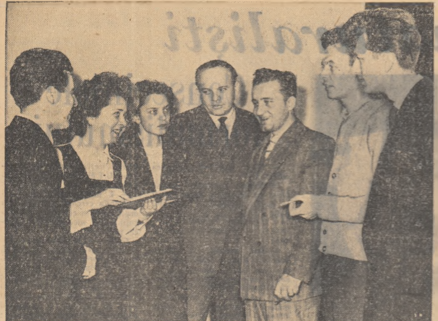
De curând au început în Capitală lucrările primei Consfățiri a Inginerilor și tehnicienilor mizeri. În fotografie: într-o pauză, un grup de tineri ingineri mizeri discutând.