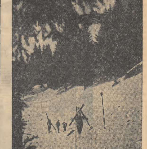
lana la București.