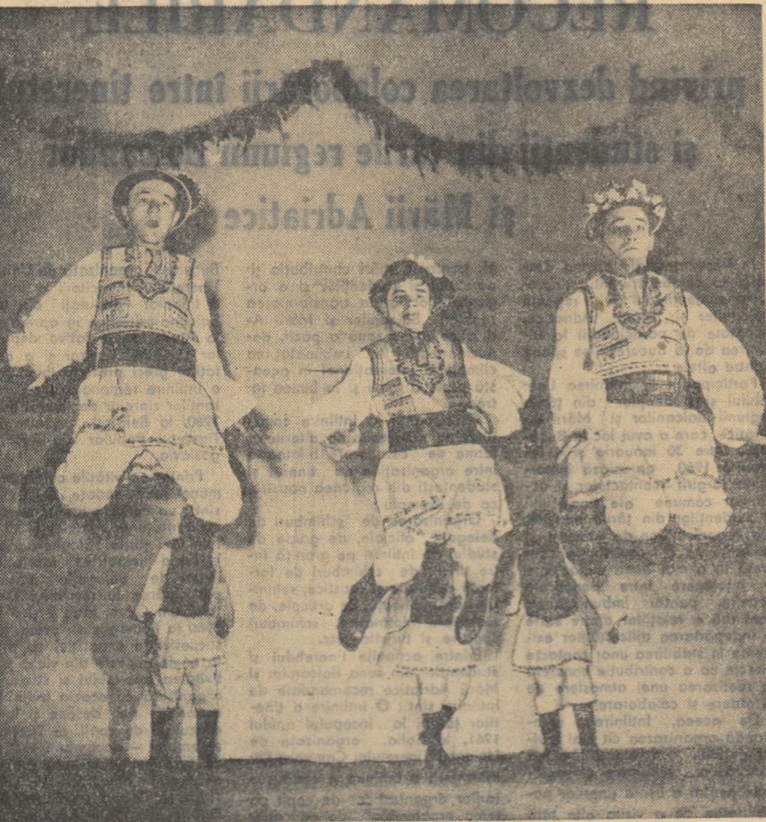
Echipa de dansuri a elevilor de la Grupul școlar profesional...