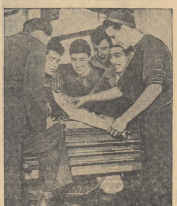
Numeroși tineri de la Uzinele „Mao Tze-tun” din Capitală urmărez cursurile de minim tehnic. Iată pe câțiva dintre aceștia studiind o schiță tehnică.