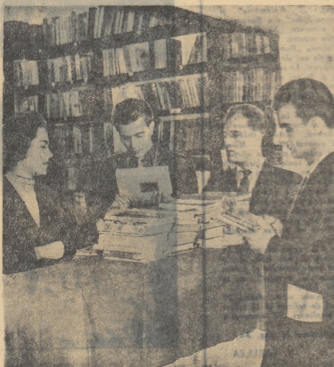
Zilnic la biblioteca clubului Uzinelor „1 Mai” din Ploiești vin numeroși tineri muncitori...