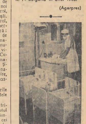
Recent s-au terminat lucrările de amenajare și modernizare a materiei din Sibiu. În fotografie aspect dintr-un salon de noi născuți.

De gria și dragostea cu care i-a fost netezită calea spre rezultate bune obținute la examenul de tehnologia chi-