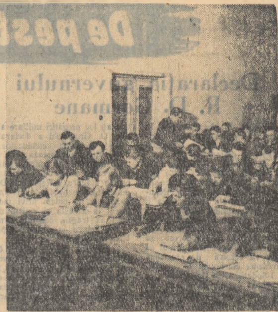
Casa de cultură a Combinatului metalurgic din Reştoa desfăşoară o activitate multilaterală. În fotografie un aspect din activitatea cercului de desen tehnic.