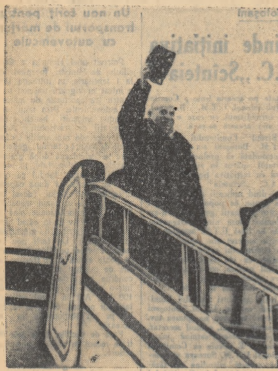
N. S. Hrușciov, pe scara avionului, solut pe cel ce l-a condus la plecarea spre Indonezia.