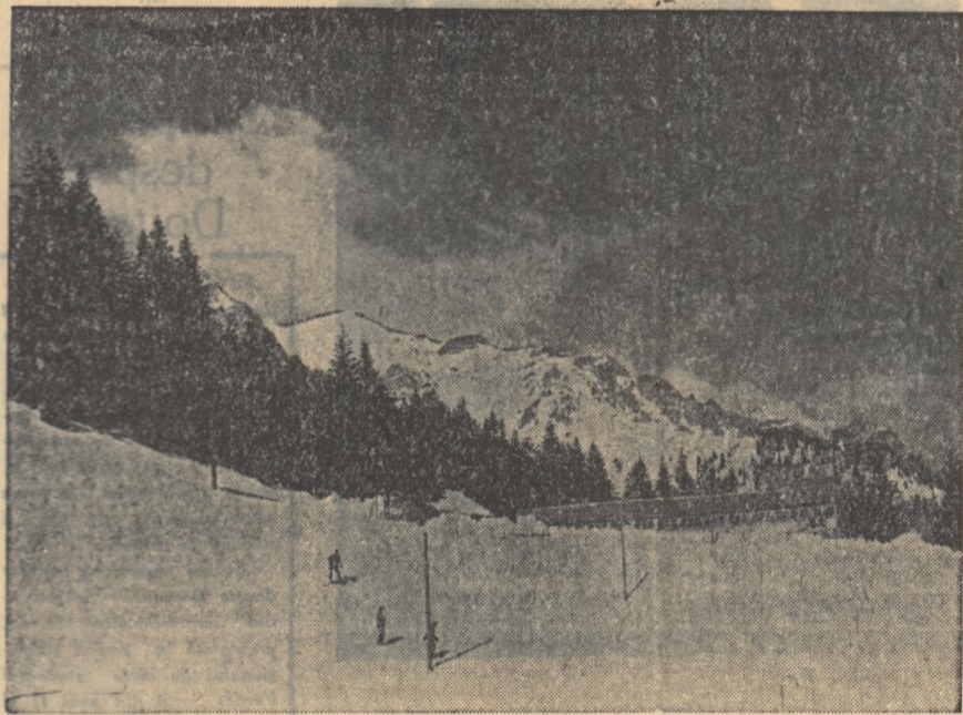
Mosivele Piatra Arsă și Caraiman văzute de la Hotelul alpin „Cota 1400”.