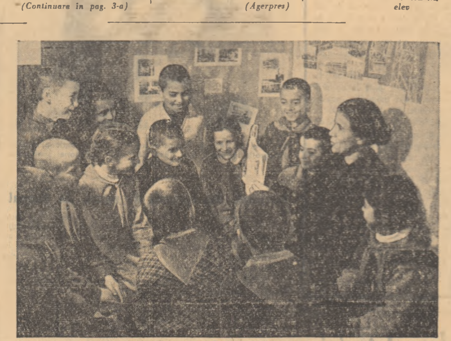
Odată pe săptămîna copiii din Ocnîța raionului Rîmnicu Vilcea se adună la cîmînul cultural unde învățătorii le citesc basme.

Excelenței sale Domnului Viggo Kampmann, prim-ministru ad-interim al Danemarcei Copenhaga Aflînd cu adînc regret tristă veste despre încetarea din viață a eminentului om de stat H. K. Hansen, primul ministru al Danemarcei, vă rog să primiți, Excelență, sincere condoleanțe din partea guvernului Republicii Populare Romine și a mea personal. CHIVU STOICA, președintele Consiliului de Miniștri al Republicii Populare Romine