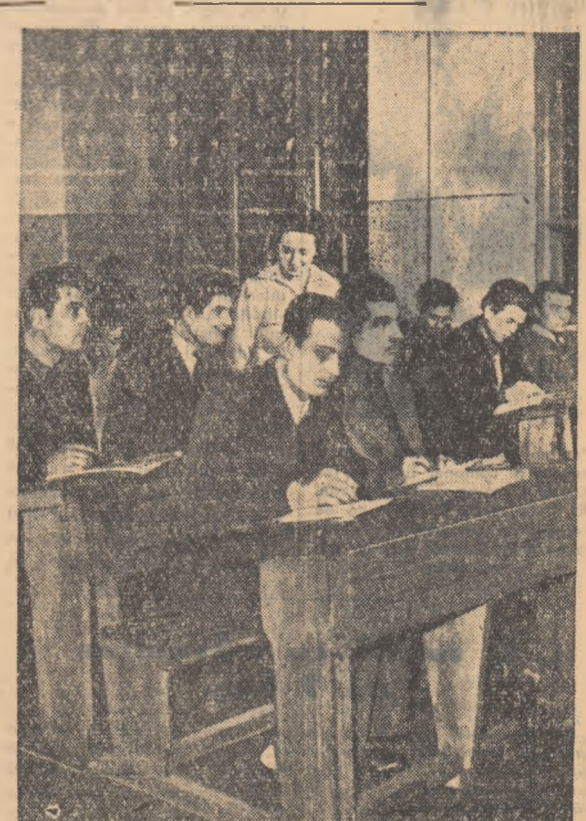
Cursurile serale ale școlii medii „Aurel Vlaicu” din Capitală sînt frecventate de numeroși muncitori de la Complexul „Grivița Roșie”, de la Depoul C.F.R. „Chivu Stoica” de mecanici de locomotivă, fochiști etc. Iată o oră de matematică la clasa a VIII-a a acestei școli.