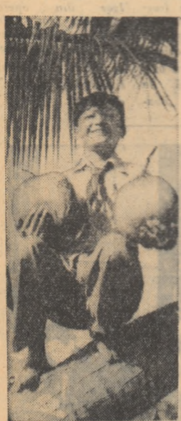
Pionierul din fotografia noastră, locuitor al comunei Tuncia, regiunea Uençian, insula Hainan, (R. P. Chineză) a mîndru că pe melegaurile comunei lui se colectează asemenea nuci de cocos uriașe.