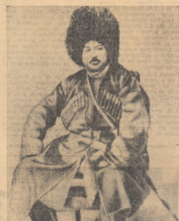
Scriitorul francez A. Dumas — tatăl în costumul național gruzin. Fotografia datează din 1858, pe timpul călătoriei scriitorului în Caucaz.