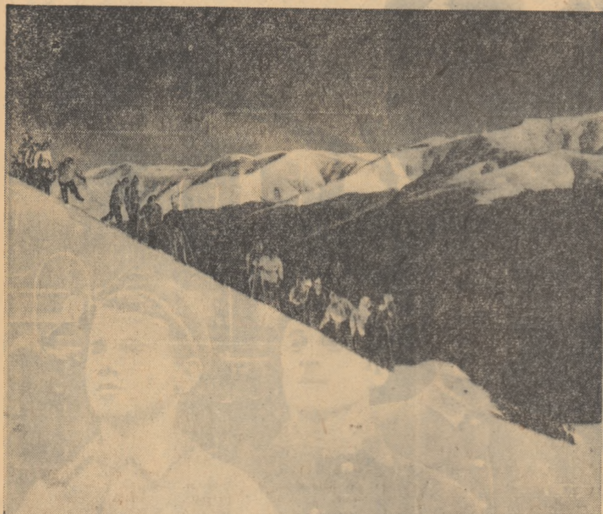
larna în Bucegi