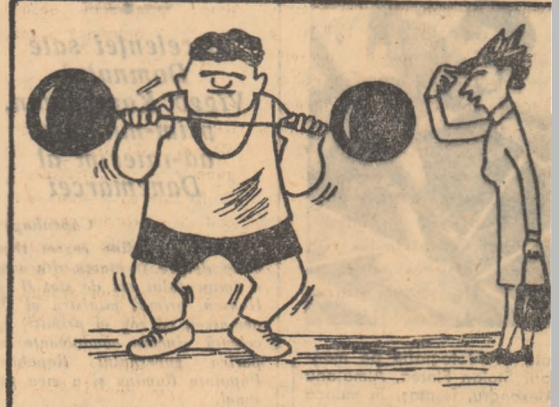
De ce te bastești cu atîta greutate. Mai bine luai alte ușoare, din masă plastică. (După revista „Nauka i jizn”)