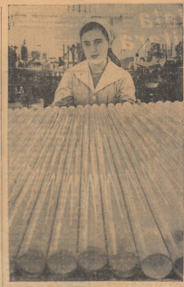
O nouă unitate modernă: