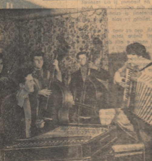
Orchestra de muzică populară a Casei de cultură a studenților bucureșteni în timpul unei repetiții.