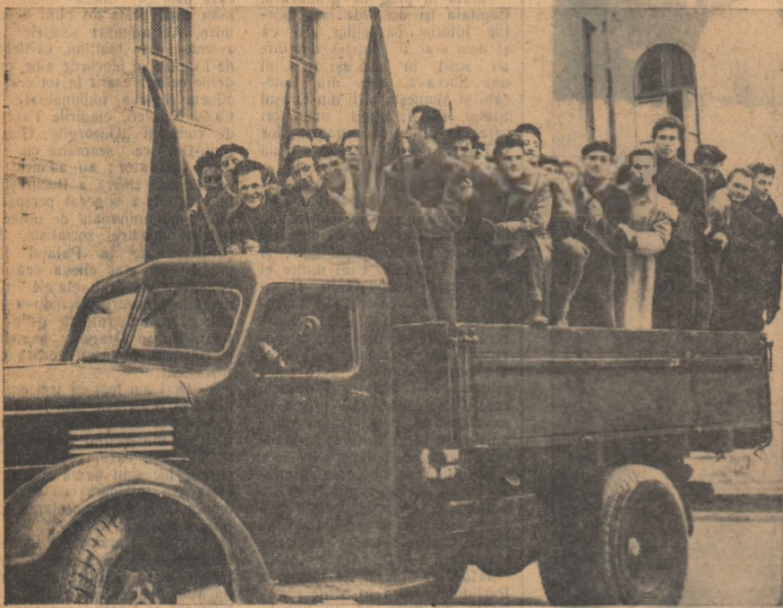
Se plăcă la muncă voluntară la stringerea fierului vechi. În fotografie: un grup de studenți de la Institutul politehnic din Galați, membri ai brigăzilor utemiste de muncă patriotică.