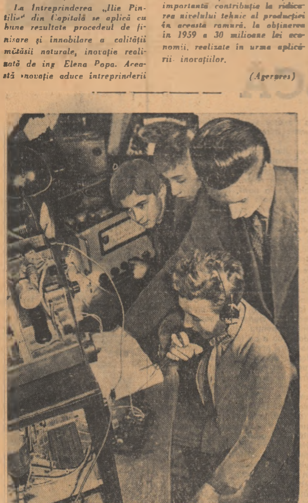
U.A.P.T.A. răspunde! Și între membrii cercului de radioamatori de la Palatul Pionierilor din Timișoara și îndepărtării lor prieteni sovietici se angajează pe loc o conversație animată.