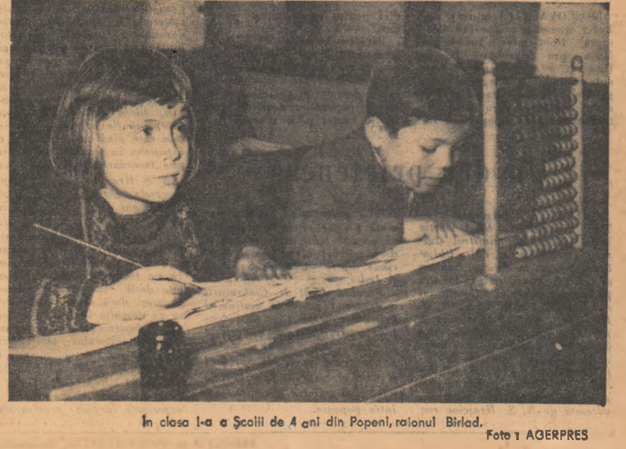
În clasa I-a a Școlii de 4 ani din Popeni, raionul Bîrlad.