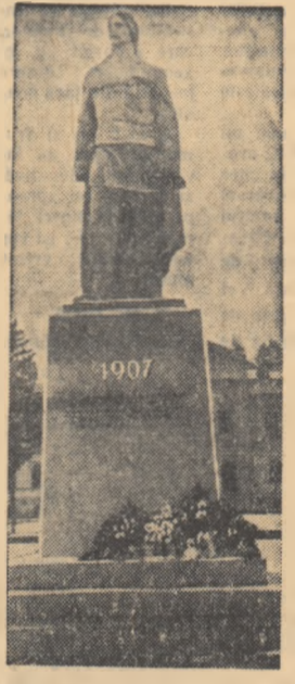
Monumentul închinat jăranilor răsculați la 1907, dezvelit zilele acestea la Pitești.