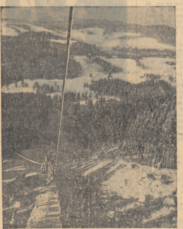
Coborînd cu telefericul de pe Cristianul Mare.