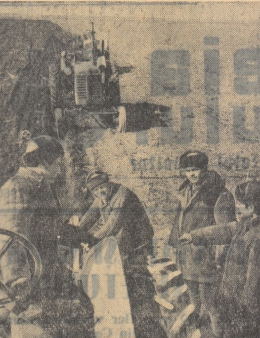
Mecanizatorii de la G.A.S. Borboși, regiunea Galați, lucrează intens la efectuarea însămînțirilor...