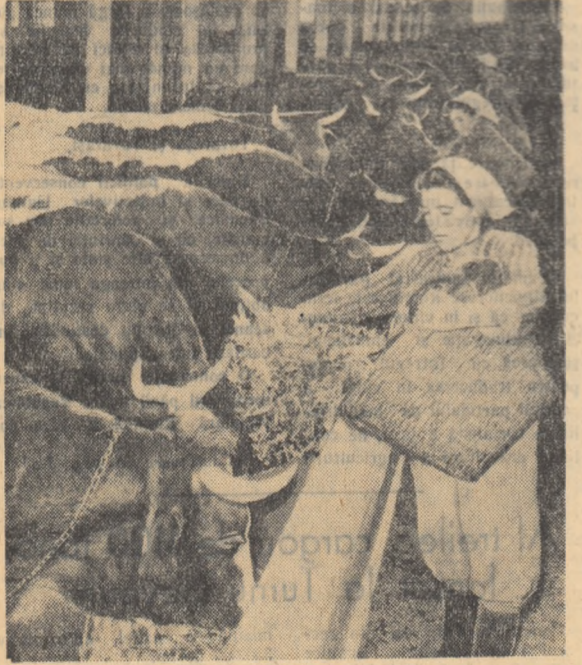
În ultimii ani la G.A.C. „8 Martie” din comuna Cobadin, raionul Negru Vodă, regiunea Constanta...

„Aici nu scrie nimic de-așa ceva. Și ce legătură are asta cu faptul că dă-mă pe mine...”