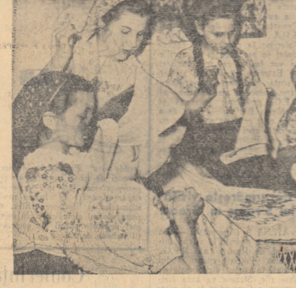
La Cercul de cusături al Găminului cultural din Poeni, raionul Iași.