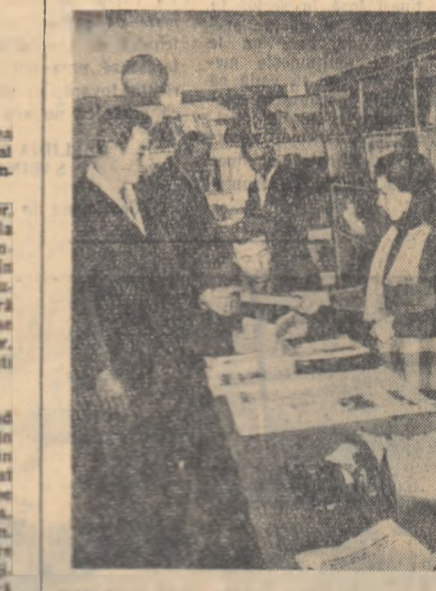
Bibliotecă din comuna Lehliu, raionul Lehi este învecinată zilnic de zeci de tineri săteni.

„Si noi am fost, la început, intr-o stare de incertitudine...”