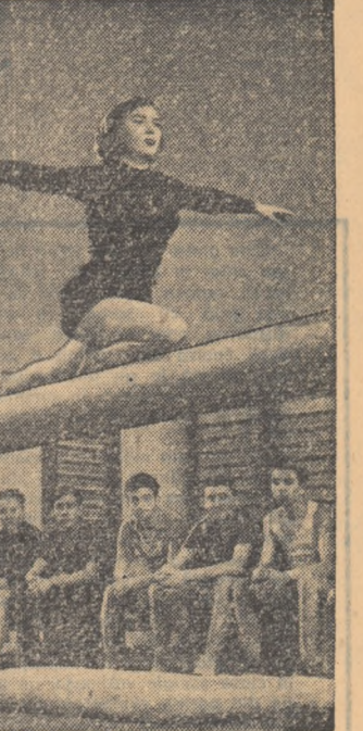
In cadrul Complexului școlar din Birlad învață peste 2.000 de elevi. La dispoziția lor se află laboratoare de specialitate, bibliotecă, săli de lectură, săli de sport etc. În fotografie: elevii clasei a XI-a A în timpul unei ore de gimnastică.

Cînd eram copii ou un șterf de veac în urmă ascultam niște banalități rimate ca : Mi te-ai lîpt de suleț/ Ca marca de scrisoare Sau : Să vină pomperii/ Inima să-mi stingă/ Să-mi stingă dorul et.