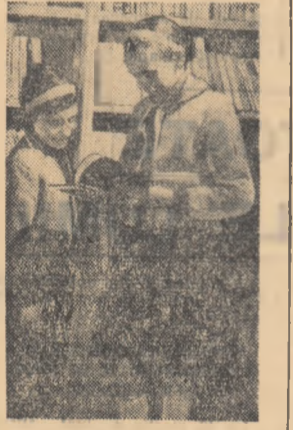
In biblioteca populară „Elena Pavel” din raionul „23 August”.