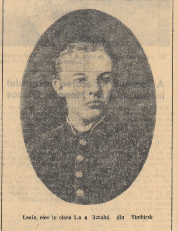
Lenin, elev în clasa I-a a liceului din Simbirsk

Cînd li se dădea să facă o compoziție acasă — scrie Dmitri Ilici — el n-o lucra nicio dată în ajunul zilei cînd trebuia să-o predă. În grabă, pierzînd noaptea, cum făceau mai toți colegii lui, îndată ce li se făcea subiectul și termenul de lucru, de obicei două săptămîni, Vla-