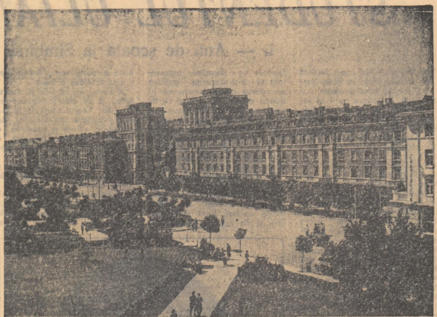
Un oraș recent apărut pe harta R. P. Bulgaria — Dimitrovgradul, lată unul din frumoasele bulevarde ale acestui tînar oraș.

MOSCOVA 12 (Agorpres). — TASS transmite: C.C. al P.C.U.S. și Consiliul de Miniștri al U.R.S.S. au hotărît ca paralele cu dezvoltarea rețelei de școli-interne să crească în orașe, așezări muncitorești și sate școli în care copiii să fie supravegheați de profesori și educatori în tot timpul zilei. Aceste școli vor lua ființă de regulă pentru elevii din primele clase și vor funcționa în localitățile de școală existente sau în cele care se vor construi de acum încolo.