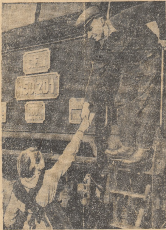
La festivitatea plecării trenurilor cu fier vechi din Ploiești spre Hunedoara, una din pionierii iminează mecanicul de locomotivă mesajul tineretului ploieștan.