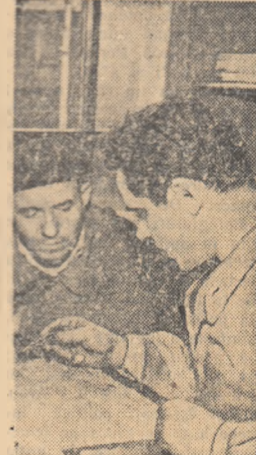
La biblioteca Uzinelor „23 August” din Capitală vin adesea numeroși muncitori pentru a consulta cărți tehnice.