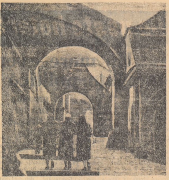
Vedere din orașul Sibiu.