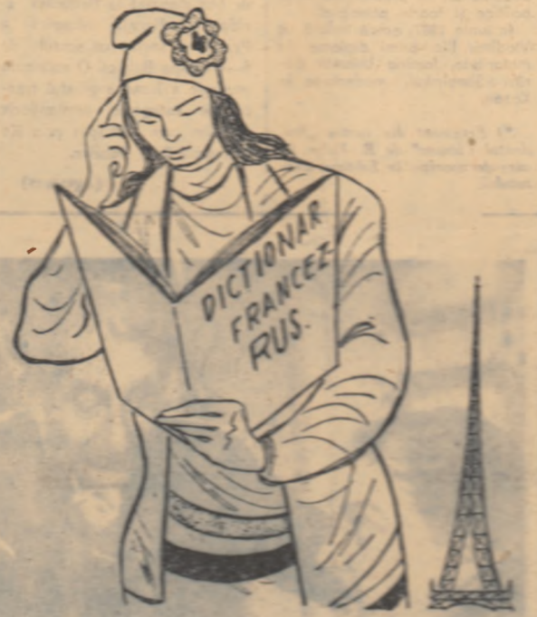
O carte mult cîntă cîntă la Paris. Desen de V. VASILEU

Germania hîteristă a fost zdrobită, însă problema pre-impunării statutului militară unuli geră se este deșelăci de actuală. Ea nu putea să nu procedeze pe oamenii politici francezi, deoarece, Franța nu ostenț a fost victima poli-oz mi-