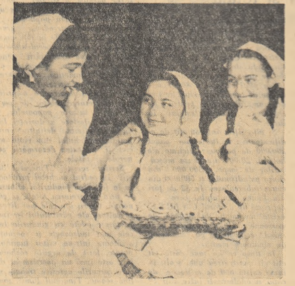
Fursecurile pregătite în secția menaj a Centrului școlar din Oradea trec un prim examen.