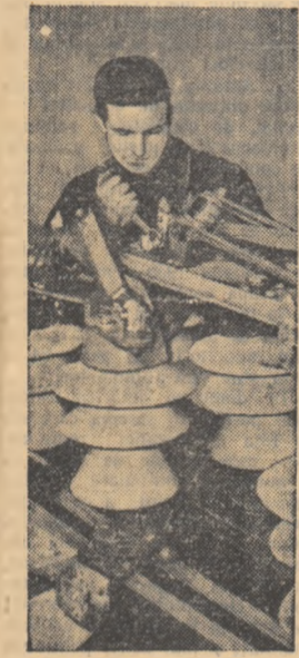
Un aspect de muncă în secția separatori a Uzinei „Electroputere” din Craiova.

În agricultură, sarcina trasată de Congresul al II-lea al partidului, ca în 1960 sectorul socialist să devină preponderent ca suprafață și ca producție marfă, a fost realizată încă de la sfîrșitul anului 1959. Sectorul socialist al agriculturii cuprindea la 1 martie a.c. 76,6% din suprafața arabilă a țării și 76,4% din totalul familiilor țărănești.