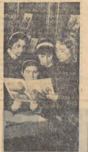
Un aspect din biblioteca Complexului școlar din Birăod.

cu motonava Transilvania Escala la: Odessa și Yalta Plecarea din portul Constanța la 1 aprilie crt. Informații și înscrieri la toate agențiile O.N.T. Garpași