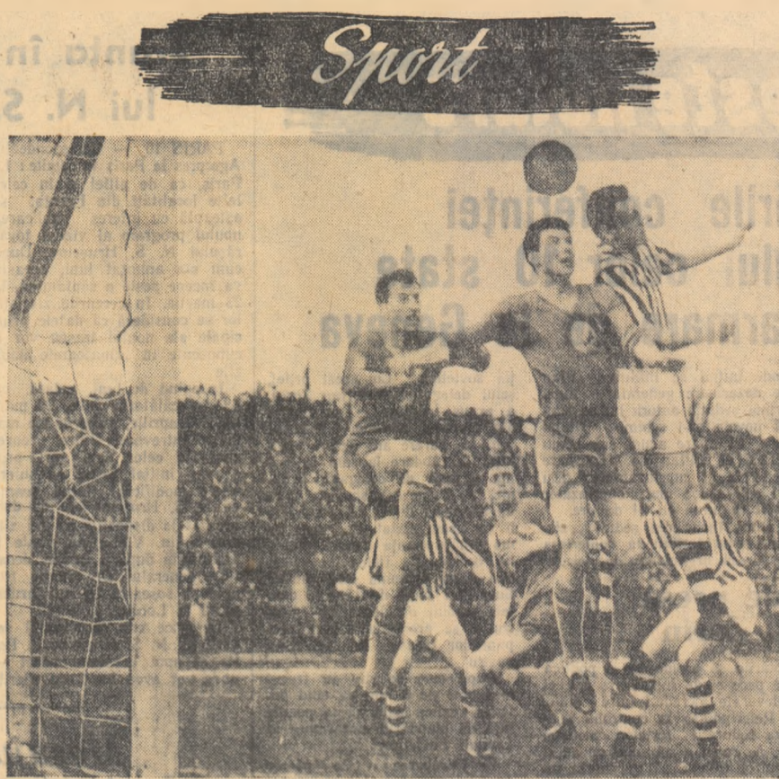
Un atac la poarta echipei cehoslovace.