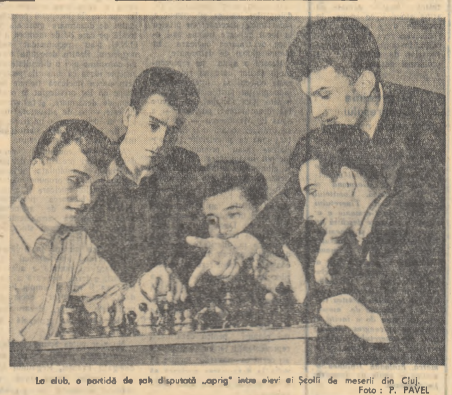
La club, o partidă de șah disputată „aprig” între elevii Școlii de meserii din Cluj.