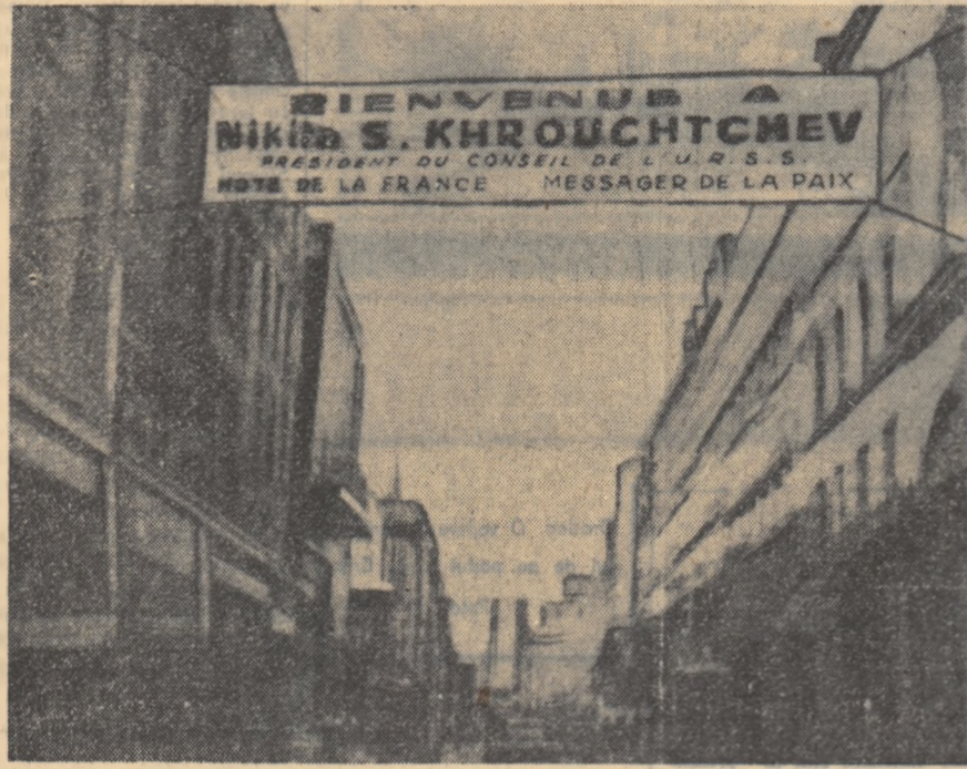
Parizul urează bun venit lui Nikita Hrușciov, oaspetele Franței, mesager al păcii

Pe aeroportul Orly unde miercuri la ora 11 va ateriza avionul cu sosește „Alușin-18” cu care reacție N. S. Hrușciov și persoanele care îl însoțesc, este gata pavilionul construit special pentru primirea oficială. Salonul în care președintele de Gaulle îl va saluta pe N. S. Hrușciov la coborârea sa din avion are o suprafață de 300 metri pătrați și este decorat cu tablouri de preț imprimat de la Muzeul Luvru, iar în centrul său se află un urias covor lucrat special la Abusson pentru Napoleon I.