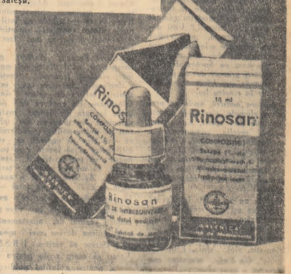
Produsul fabricii de medicamente „Galentica”.

RINOSAN. La rinite, rino-faringite, guturai cronice folosiți Rinosan picături. Se găsește la farmaci, drogherii și puncte farmaceutice sătești.