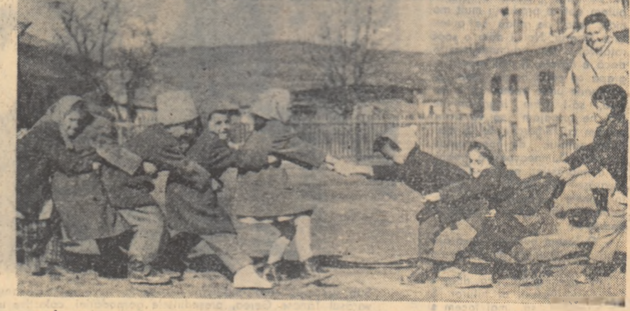
În zi de primăvară la grădinița de copii a întreprinderii „Vitrometani” din Mediaș.