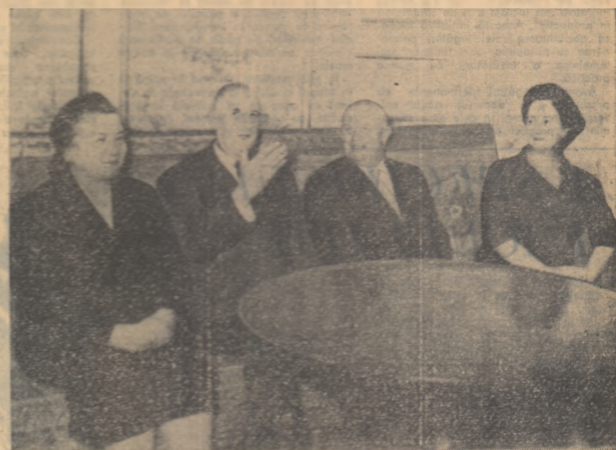
Nina Hrușciova, generalul De Gaulle, N. S. Hrușciov și doamna De Gaulle la Palatul Elysee din Paris