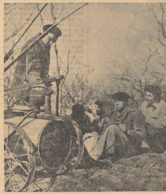
Studenții ai Facultății de construcții din Cluj pe construcția Palatului Sporturilor din Cluj.