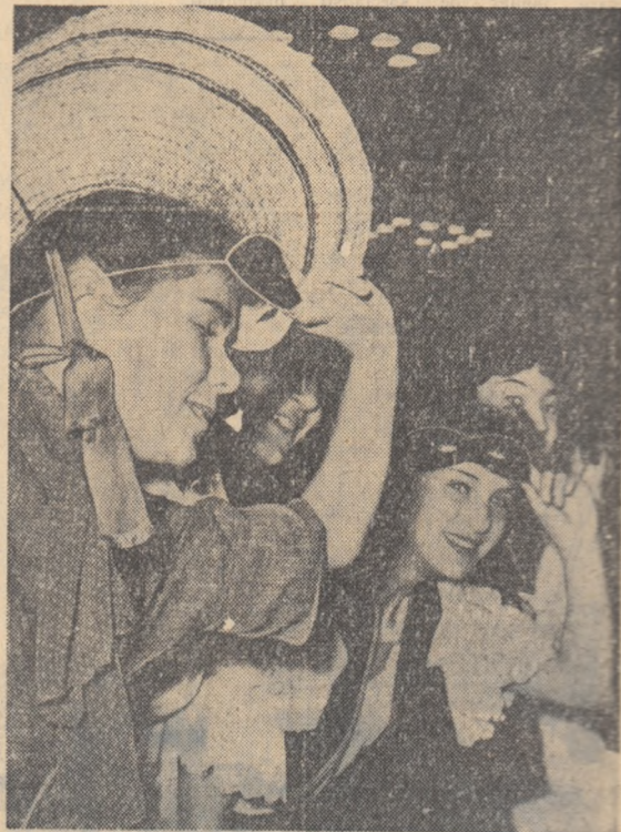
Un aspect din timpul Carnavalului