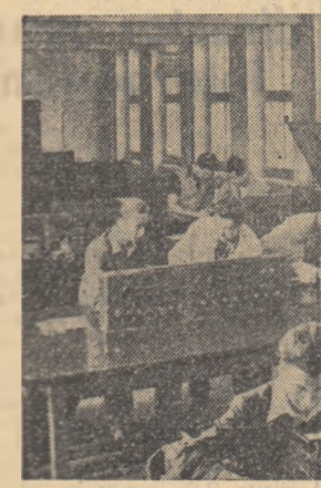
La catedra de mașini electrice de la noua Universitate din Miskolc.