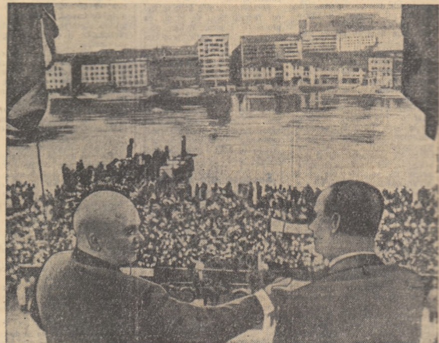
Francezii îl primesc cu entuziasm pe N. S. Hrușciiov. În clișeu — N. S. Hrușciiov și primarul Marsiliei, Defferre, admirînd panorama portului.

Citiți în pag. 4-a Amănuntele vizitei lui N. S. Hrușciiov în Franța