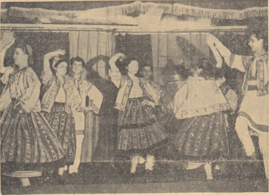
Echipe de dansuri populare a clubului întreprinderii „Partizanul” din Bacău, în timpul unei repetiții.

a participat la lucrările sesiunii Comitetului Executiv al F.M.T.D. ce s-au desfășurat la Conakry (Guineea).