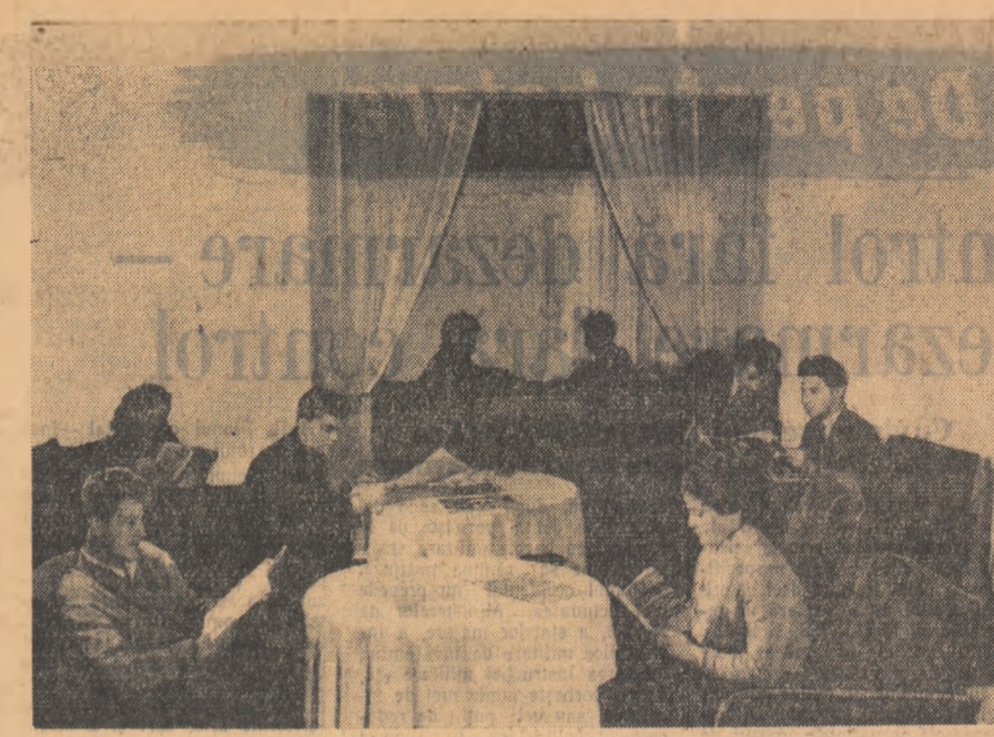
În clubul minerilor din Gheorgheni, regiunea Hunedoara

În regiunea Pitești se desfășoară o largă acțiune pentru construcția și amenajarea de noi baze și terenuri sportive folosindu-se resursele locale și prin munca patriotică a tineretului. În orașul Pitești au început lucrările de construcție a unui complex sportiv care va cuprinde un mare stadion cu o capacitate de peste 20.000 de locuri, conceput după modelul stadionului „23 August” din Capitală. Pînă acum s-au efectuat prin munca patriotică săpăturile fundației în valoare de 800.000 lei. Într-un stadion avansat se află construcția bazei sportive din comuna Ștefănești situată în apropiere de „Orășelul” metalurgicilor de la Uzina „Vasile Tudose” Coțlești. Această bază sportivă cuprinde terenuri de fotbal, volei, tenis de cîmp, un bazin de înot în lungime de 50 m, o piscină modernă și altele. Valoarea construcției, inclusiv tribunele se ridică la suma de 4 milioane lei. Lucrările de amenajare s-au efectuat numai prin munca voluntară a metalurgistilor. Asemenea construcții sportive se execută în întreaga regiune.