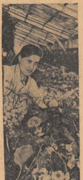
În sera de flori a G.A.S. Paștii-Leordeni.

În perioada concursului studenții-artiști amatori vor prezenta spectacole și în marile întreprinderi bucureștene, precum și la casele de cultură al tineretului. (Agerpres)