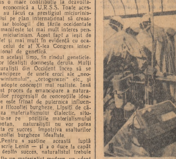
La un spital din Praga funcționează un nou aparat medical fabricat în R. Cehoslovacia. Verba de un cardio-tacometru cu tranzistori care înregistrează ritmul bătăilor inimii.

S. GHÎȚĂ Cercetător principal la Institutul de filozofie al Academiei R.P.R.