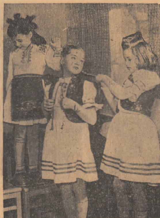
Îmbrăcate în costumele naționale lucrate chiar de ele, cîteva pioniere de la Palatul pionierilor din Oradea se pregătesc pentru spectacol.