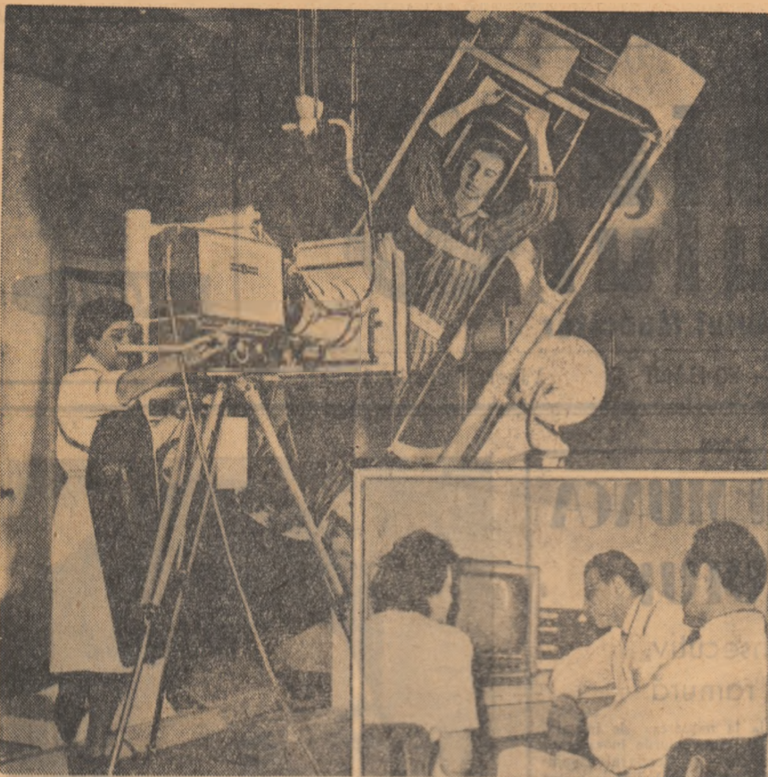
Fotoreporterul nostru a prins pe peliculă câteva din aparatele stației de radioizotopografie cuplată cu o stație de televiziune ce funcționează la clinica medicală a Spitalului „Vasilie Roșică”, din Capitală.