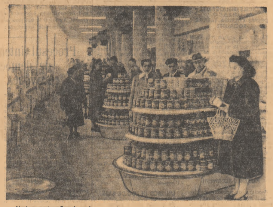
Noul magazin „Comalimint” cu autodeservire din b-dul 6 Martie nr. 85 din Capitală.

ciclu de învățămînt, ci trecerea de la o clasă la alta în cadrul învățămîntului de 7 ani, Ministerul Învățămîntului și Culturii a stabilit ca, începînd cu acest an școlar, să nu se mai lîină examen de absolvire a clasei a IV-a. În viitor, elevilor care vor promova clasa a IV-a în cadrul unei școli cu clasele I-VII nu li se vor mai elibera certificate de absolvire, înscrierile lor în clasa a V-a urmind să se facă numai pe baza situației încheiate la sfîrșitul anului școlar. Elevilor care vor promova clasa a IV-a la o școală de 4 ani li se vor elibera adeverințe în vederea înscrierii în clasa a V-a la școala de 7 ani cea mai apropiată.