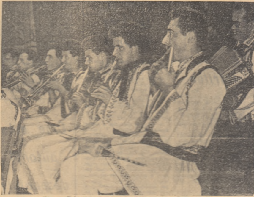
Concertul orchestrei de muzică populară „Miorța” a Universității „Al. I. Cuza” din Iași dat în cadrul unei sărbători în onoarea a formațiilor artistice studențești.