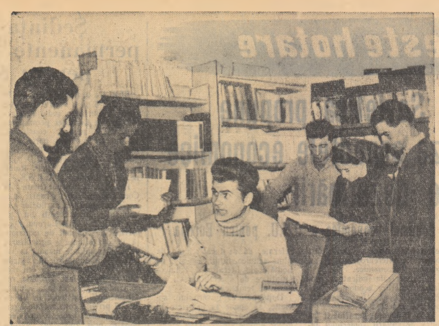
Un aspect din biblioteca căminului cultural din comuna Furculești, raionul Alexandria