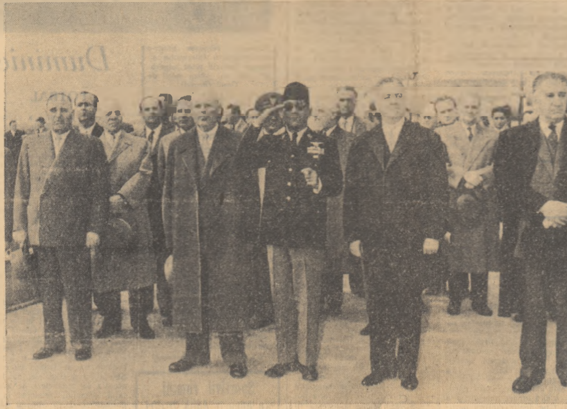
La sosire pe aeroportul Băneasa.