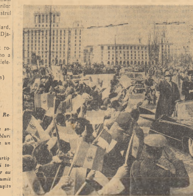
Locuitorii Capitalei îl salută cu căldură pe președintele Sukarno.

Luni seara, la Teatrul de Operă și Balet al R. P. Romine a avut loc un spectacol de gală dat în cinstea președintelui Republicii Indonezia, dr. Sukarno. În sală se aflau membri ai Preziidiului Marii Adunări Naționale, miniștri, conducători ai instituțiilor centrale și ai organizațiilor obștești, generali și ofișeri superiori ai forțelor noastre armate, oameni de știință, artiști și culturi. Erau prezenți și misiunilor diplomatice acreditate în R. P. Romină și membri ai corpului diplomatic.