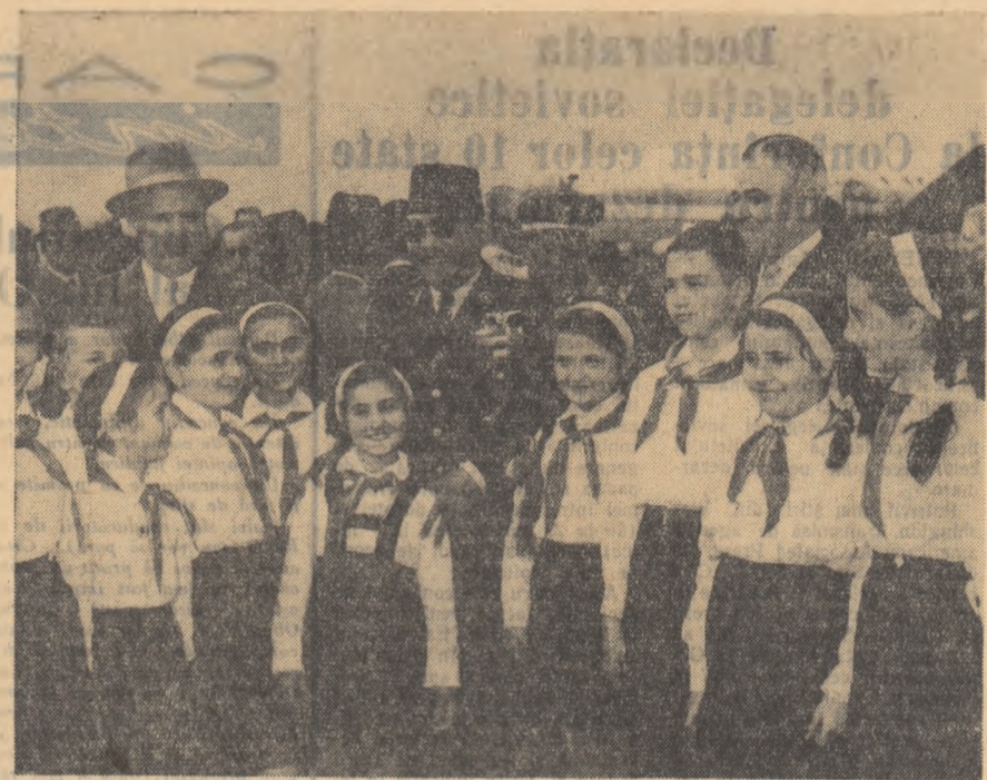
Un aspect de la sosele pe aeroportul Băneasa.