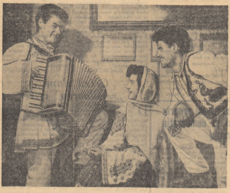
La clubul cooperativei „Valea Jiului” din Petroșani, inaintea spectacolului.