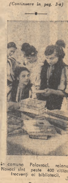
În comuna Palovraci, raionul Novaci sint peste 400 cititori frecvenți ai bibliotecii.