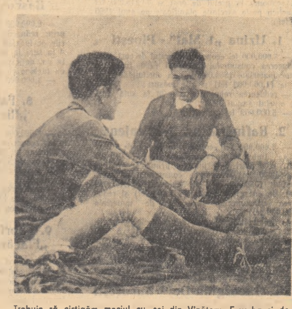
Trebuie să citișim meciul cu cei din Vinătoru. E vorba și de onoarea gospodăriei!