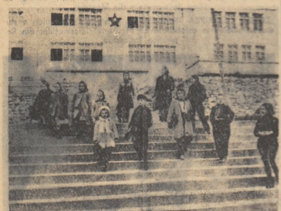
În R. P. Bulgaria s-au construit în anul de democrație populară numeroase școli. Imaginea noastră vă prezintă copii învățând în noua școală din satul Șipca.

83 la sută din persoanele chestionate au propus largirea programului de schimburi cu țările socialiste în domeniul turismului, culturii și științei, 75 la sută au declarat că Statele Unite trebuie să depună eforturi mai mari pentru a micșora barierele comerciale, 69 la sută au cerut „să fie folosite toate posibilitățile pentru tratate” cu țările socialiste, 64 la sută au cerut ca guvernul american să-și modifice politica în problemele dezarmării. Majoritatea celor chestionați s-au pronunțat în favoarea modificării actualului statut al Berlinului.