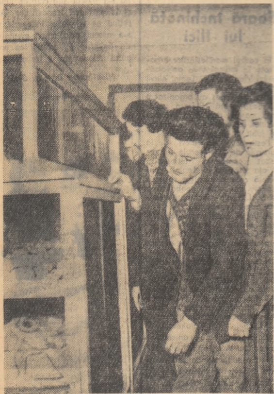
E cu cît mai interesant muzeul arheologic de pe lângă căminul cultural, cînd ei contribuie la completarea lui cu piese găsite în săpături.