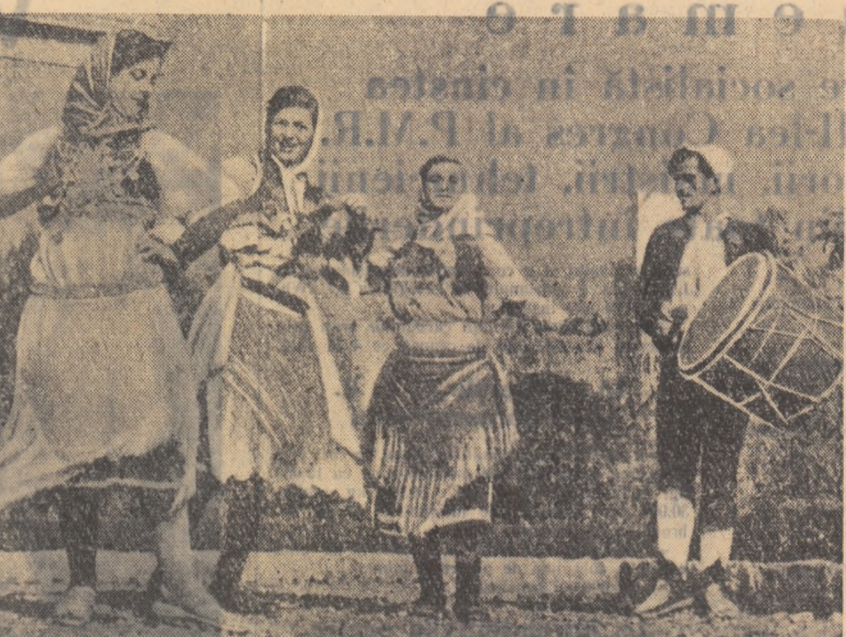
Fineri dansatori din localitatea Tropoia (R. P. Albania).

ATENA 12 (Agerpres) — TASS transmite: După judecarea de către Curtea de Apel din Atena a recursului lui M. Glezos împotriva recentei sentințe a Tribunalului penal din Atena, la 11 aprilie Manolis Glezos a fost din nou transferat la închisoarea medievală pentru deținuții de drept comun de pe insula Corfu. După cum a declarat un fost membru al Uniunii Comuniste din țara noastră este