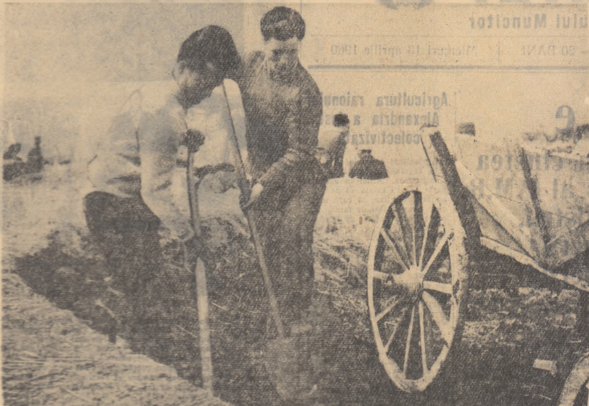
În 20 de zile, ei și-au făcut treaba. Tinerii muncesc alături de toți colectivizii, zi de zi.

— A fost o lecție foarte bună pentru cei trei „culanșii” și pentru toți tinerii — subliniază Dumitru Mitran. După adunarea aceea în care amintim le-am auzit pe cei trei că sîntuți colectivizii trebuie să muncim mai mult și să sporosim averea noastră comună ca să trăim cu toții mai bine. Și în afară de asta nu e demn pentru un tînar să fugă de muncă”.