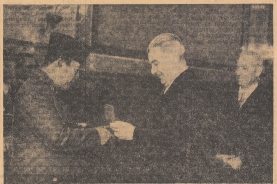
Aspect de la decorarea președintelui Sukarno.