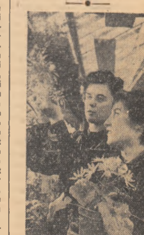
Cele două tinere pe care le vedem în fotografie sint de la I.M.S. Cimpulung. Ele își înfrumusețează locul de muncă cu ghivece de flori primite de la sora întreprinderii.