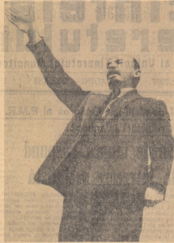
Lenin vorbind la un miting, la 1 Mai 1919.

Am 66 de ani astăzi, dar de cînd eroc vîrșurile cînd am luptat în gărziile roșii îmi pare ca reînvierec.