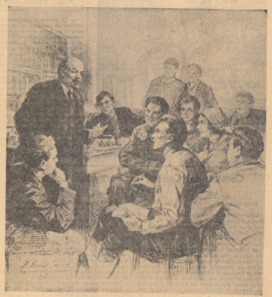
Delegați la primul Congres al Comsomolului în vizită la Lenin desen de: P. VASILIEV

PETRE GRAMADA comuna Dorna, raionul Vatra Dornei, regiunea Suceava