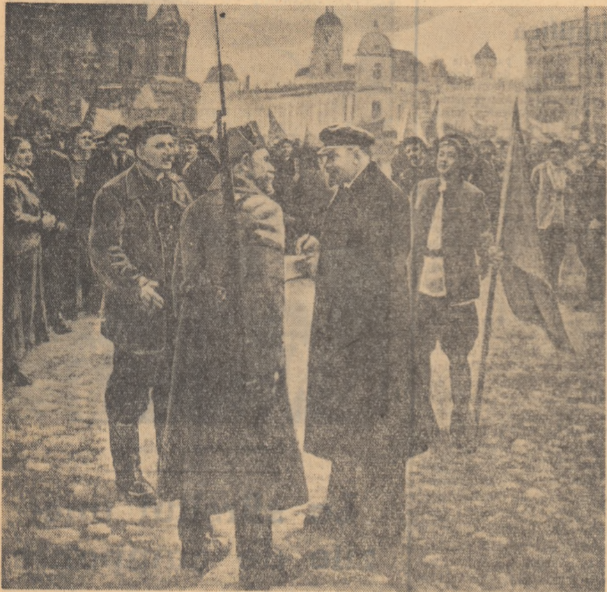
V. I. Lenin în 1919 pictură de: D. A. NALBANDIAN