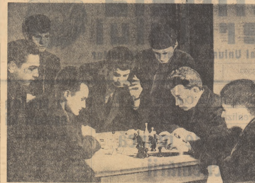
Șahul este unul din sporturile preferate de tinerii muncitori ai cooperativei „Valea Jiului” din Petroșani, lată-i pe cițiva dintre ei disputîndu-și înfăptuindu-și un partid de șah.