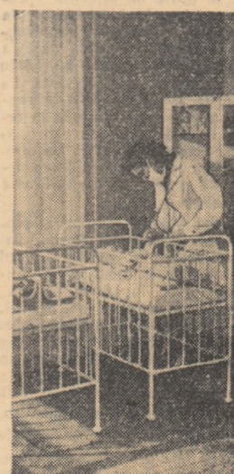
În salonul născuților al dis. pensarului medical din comuna Lencuș, regiunea Timișoara