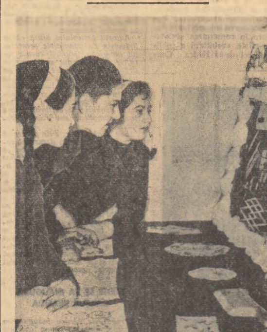
Elevi din clasa a IX-a D a Școlii medii nr. 1 din Craiova la cabinetul metodic al școlii privind de ei în timpul orelor practice.

GAJAT SA REALIZEZE ÎN ACEST AN PEȘTE PLAN UN CUMAR TOTAL DE 75.060.000 LEI ECONOMII LA PREȚUL DE COST ȘI 43.237.000 LEI BENEFICIILOR. Angajamentele colectivelor de muncitori din întreprinderile regiunii Stalin, Baia Mare, Constanța, Suceava înalte ca răspuns la chemarea la întrecerea socialistă de cele 19 întreprinderi, sînt a puternică expresie a dorinței lor de a întâmpina cel deal III-lea Congres al Partidului Muncitoresc Român cu noi succese pe drumul construcției socialiste și al ridicării continue a nivelului de trai al celor ce muncesc. Muncitorii, maeștrii, tehnicienii și inginerii din regiunile Stalin, Baia Mare, Constanța și Suceava, alături de toți oamenii muncii din patria noastră, sînt hotărîți să-și consacre întreaga lor capacitate luptei pentru obținerea de produse de calitate la un preț de cost cit mai scăzut pentru a ocupa astfel un loc de frunte în această înaltă întrecere.