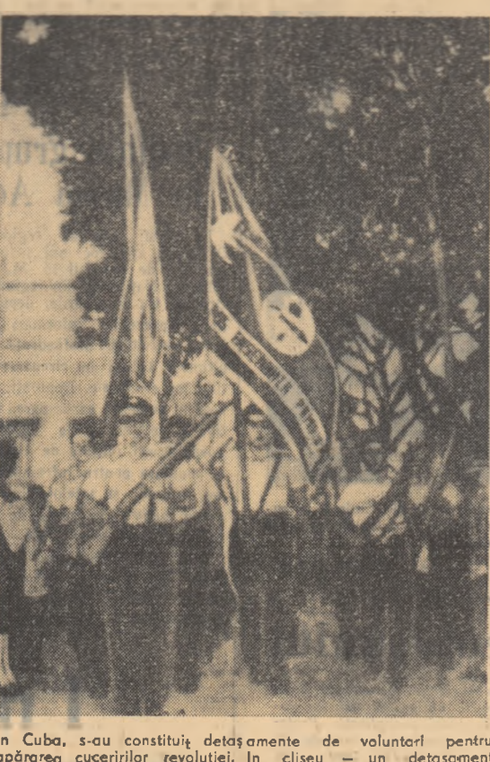
În Cuba, s-au constituit detașamente de voluntari pentru apărarea cuceririi revoluției. În clipă — un detașament de studenți.

„Nedeala” — suplimentul de dimineață al ziarului „Izvestia”, a publicat sub semnătura călătorului oceanologic sovietic Leo Zenkeci, președinte Comisiei de Științe a U.R.S.S., un articol consacrat problemelor forajelor în fundul oceanului. Articolul arată că se începe de adevărate proiective americane, potrivit cărora forajele de pe bordul unei nave în desfundarea de 4,5 km de pe fundul oceanului ar putea să se facă în timpul oceanului și dintr-o singură dată în scara profesională. După „Zvezda” profesional Zenkeci, acest proiect este prea complicat sub raport tehnic. Leo Zenkeci este de părere că gândirea tehnică în domeniul cunoașterii fundului oceanului se va oriența spre realizarea unor instalații autonome de foraj. Asomenea instalații vor putea fi coborâte pe fundul oceanului și de către bărcile autonome autopropulsate. Autorul articolului crede că o mare cunoaștere a forajelor oceanului, ținele și rezultatele lui. Se poate afirma cu siguranță, declară el, că pătură secol va fi secolul cuceririi și valorificării nu numai a Cosmosului, ci și a scoarței pământului sub fundul oceanului.