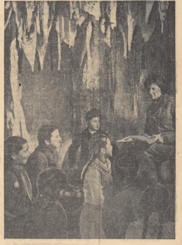
La cercul de basme al Pola tului pionierilor din Oradea.