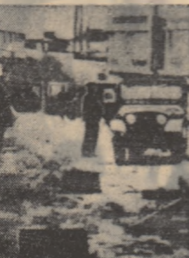
Străzile orașului Seul, populația demonstrînd împotriva regimului violent al cîndin între poliția și populația (dreapta).