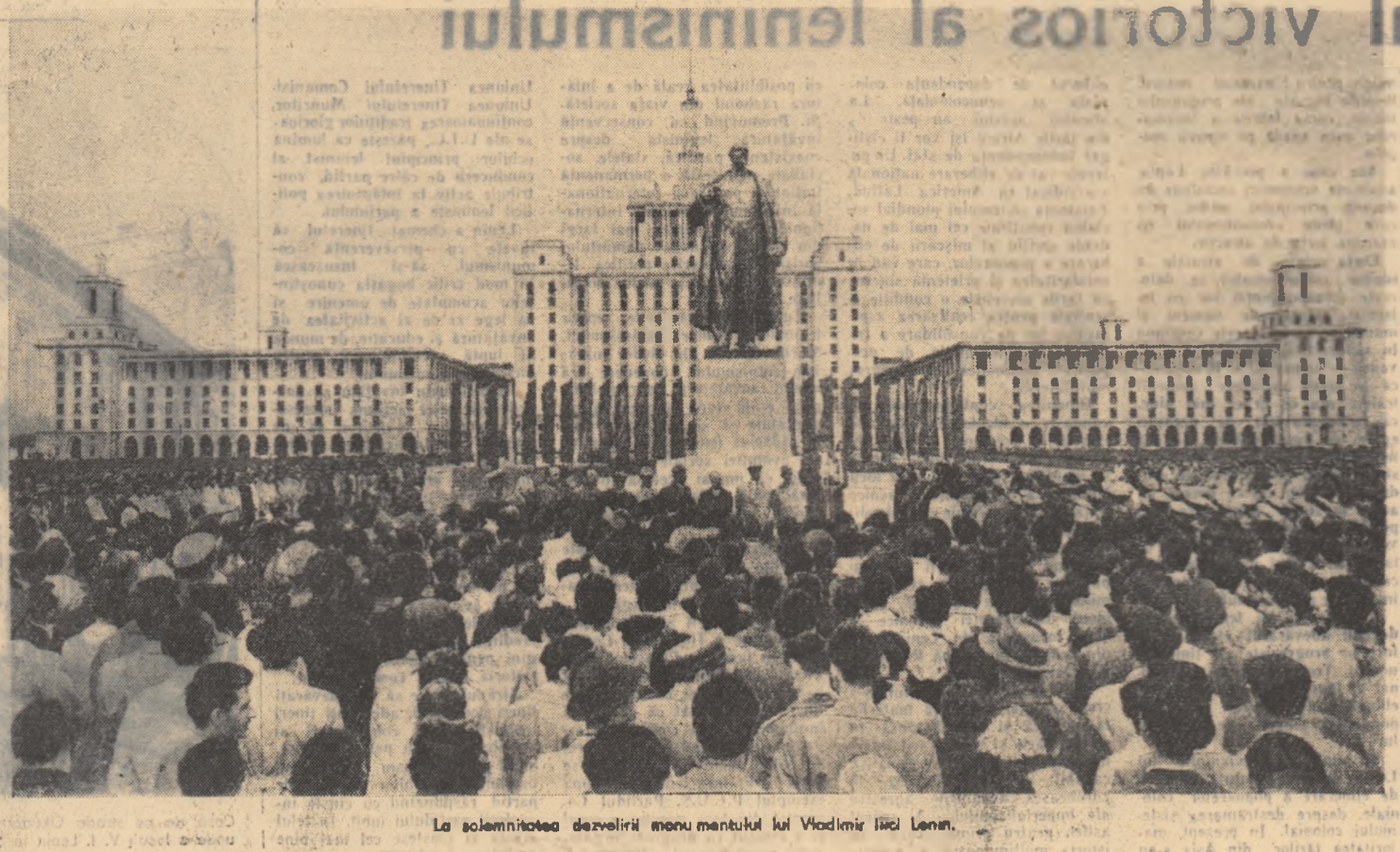
La solemnitatea dezvelirii monumentului lui Vladimir Ilici Lenin.

Constructorii de pe șantierul Hidrocentralei din Bicaz, care poartă numele lui Vladimir Ilici Lenin, cîntăste cu realizări deosebite cea de-a 90-a aniversare a nașterii marelui învățător al proletariatului din întreaga lume. Constructorii hidrocentralei pe care muncitorii de aici s-au angajat să o dea în funcțiune, parțial, anul acesta a avansat mult în ultima vreme. La 10 aprilie, cu aproape 3 luni mai devreme decît era stabilit în plan ei au terminat construcția tunelului de aducțiune — noua cale subterană a apelor Bistriței. La barajul hidrocentralei s-a turnat pînă acum peste 85 la sută din volumul total de beton prevăzut. De la începutul acestui an și pînă în prezent constructorii barajului au turnat în corpul marelui stăvilar 33.000 mc de beton peste planul la el.