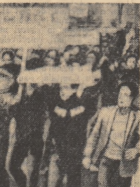
Două aspecte în timpul luptelor din Coreea de Sud. Pe stînga: Orașul Masan după lupta lîșmanist (st. Ingo). Pe dreapta: Orașul Masan după lupta lîșmanist (st. Ingo).

Revista cuprinde de asemenea rubricile: „Pe scurt despre cărți”, „Din viața cadrelor”, „Viața științifică”, „Mișcarea filozofică de peste hotare”, „Note”.