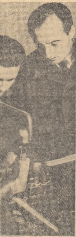
Un grup de studenți de la Facultatea de mecanică din Timișoara în timpul practicii în producție.