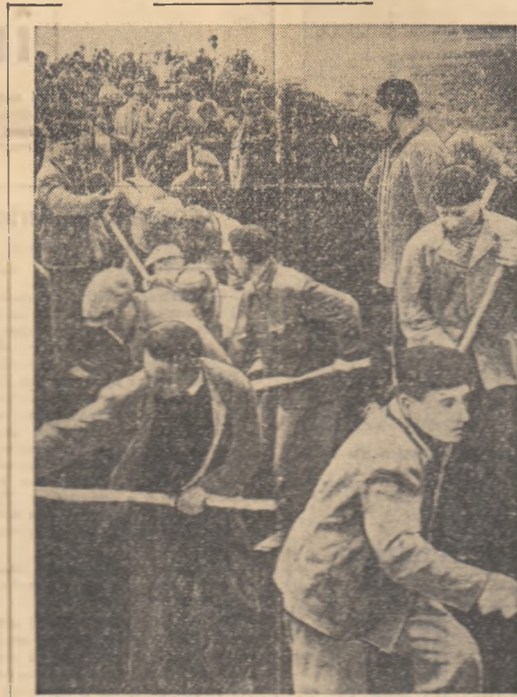
Tineri romîni, maghiari și germani participă cu însușirea în muncă patriotică pe șanberul de la Sinpetru, raionul Coșla.