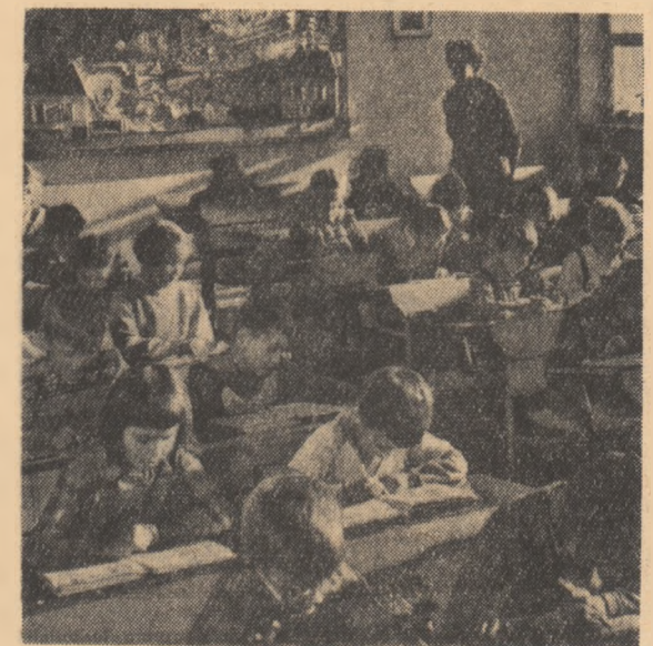
Săli de clasă curate, spațioase și luminoase stau la dispoziția tînărora muncii cehoslovaci.