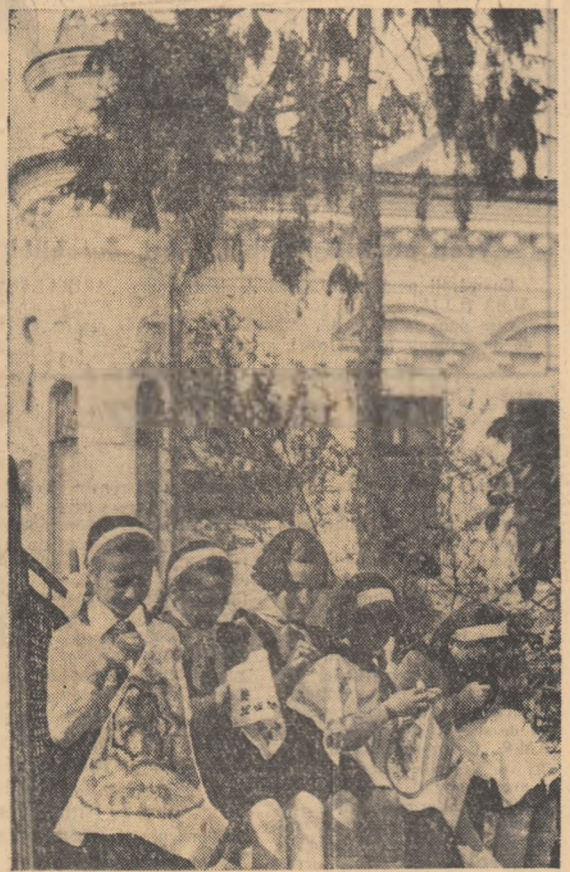
La Casa pionierilor din Iași.

Ziua Victoriei! Ascultați-i, cum mai cîntă în amintire soldații din răsărit, din apus, peste ruina timpului dus. Mai spuneți-mi această poveste începută în zilele-acele, cu liniștea lumii și-a țării mele, cu copii și bătrîni și nevaste, bucuroși de lumina de-afară. Mai spuneți-mi de primăvară!