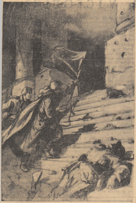
Cu drapelele sovietice, urcând treptele Reichstagului. (desen din volumul „Sturm Berlina”)