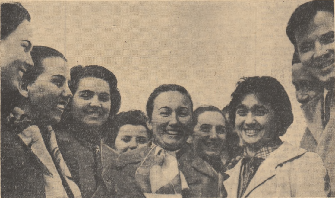
În fotografie: un grup de elevi de la Școala serală muncitorească de pe lângă Fabrica de postav Buhuși împreună cu directorul lor.