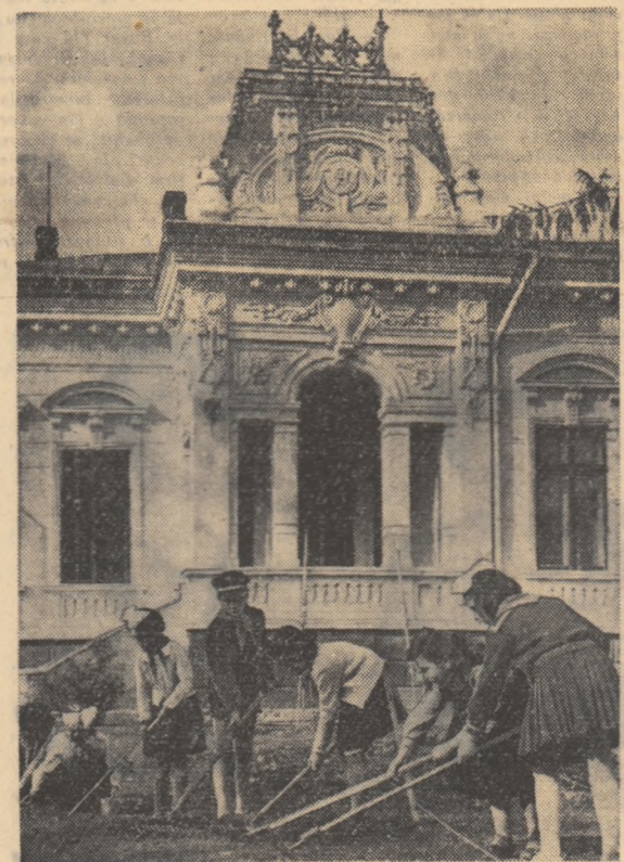
Un grup de pionieri din Iași lucrînd la amenajarea gradinilor din fața Casei pionierilor din localitate.