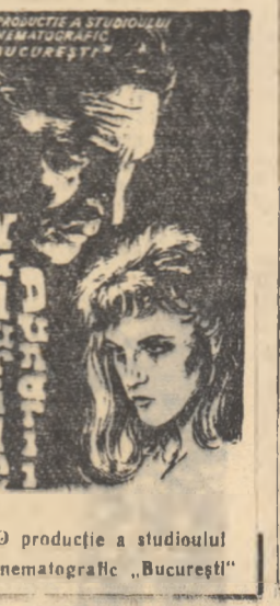
O producție a studioului cinematografic „București”