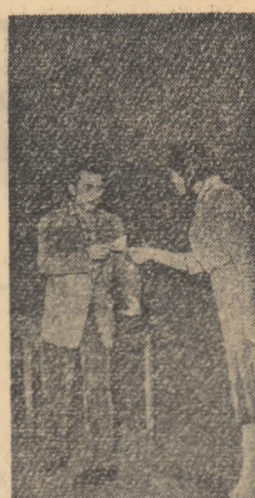
Scenă din piesa „Nu-i atât de simplu” interpretată de actorii-amatori din cercul de teatru în limba germană al Casei de cultură orășenești din Medias.