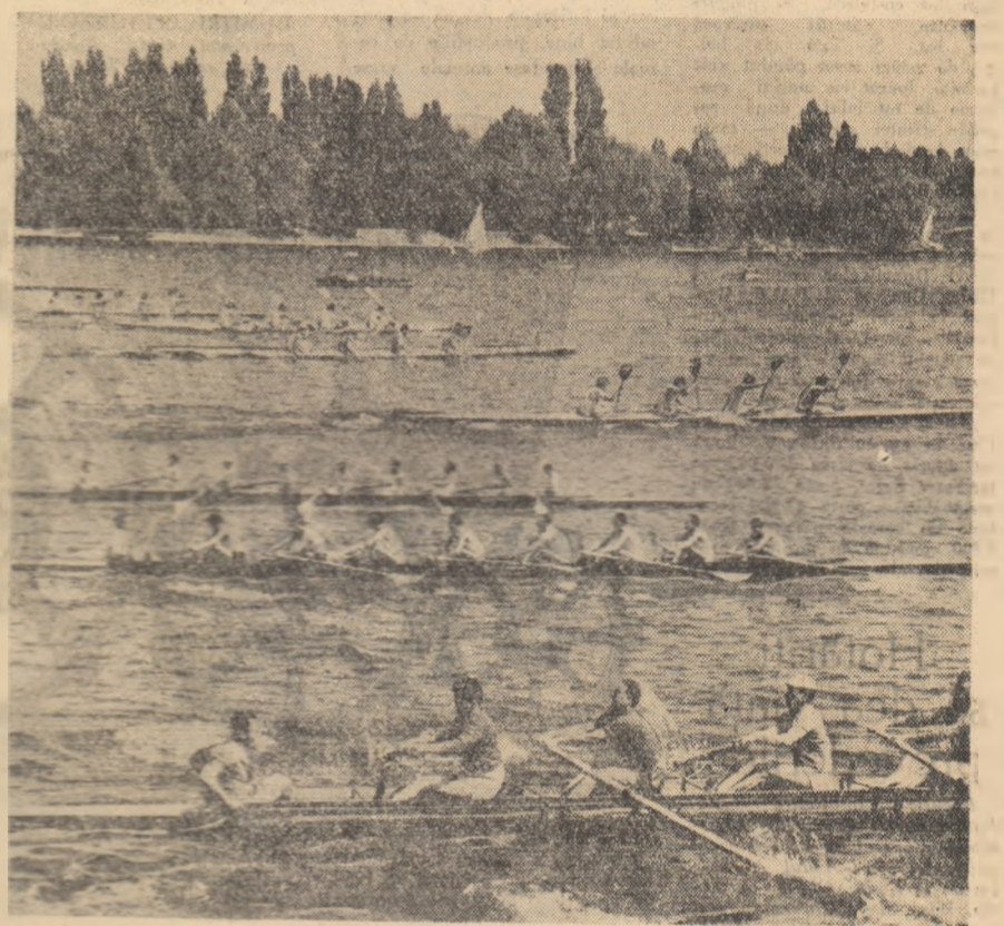
„Cupa Victoria” a reunit simbolic și duminică la startul întrecerilor disputate pe lacul Herăstrău, pe cei mai buni dintre canotorii bucureșteni.