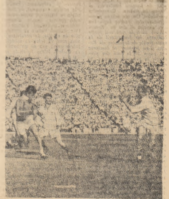
Selecționata de rugbi a Bucureștilor a învins duminică pe stadionul „23 August” formația P.U.C. de care a dispus cu scorul de 41-3.