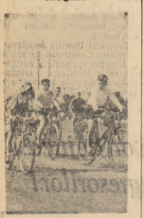
O nouă caravană de cicliști și-a pornit drumul dîmineața către Mogoșoaia. După o excursie interesantă ei se vor întoarce plini de voie bună în București.