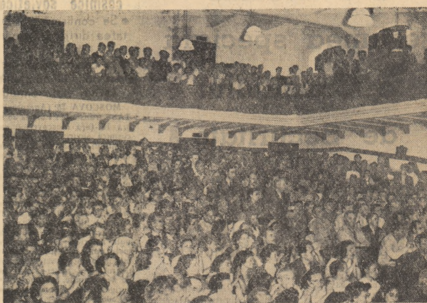
În timpul mitingului de la Institutul Politehnic din Capitală.