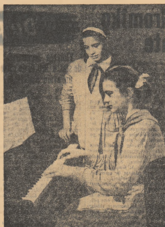
Eleve din Craiova studiind pianul în cadrul Casei de cultură a sindicatelor din oraș.