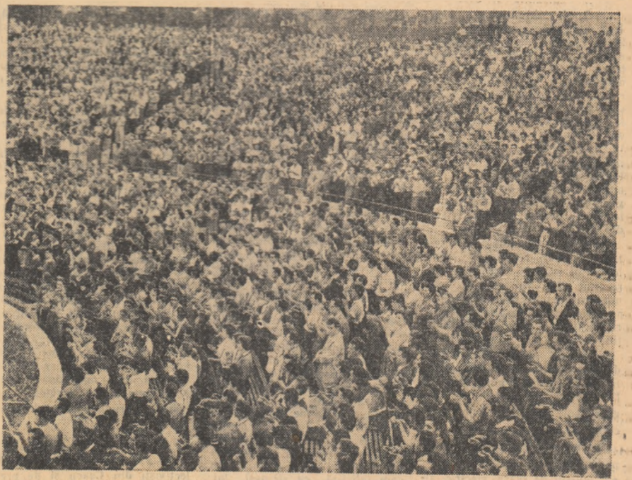
Un aspect de la miting.