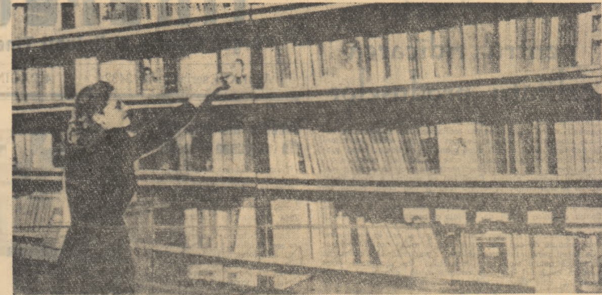
Biblioteca clubului central Bicăz.