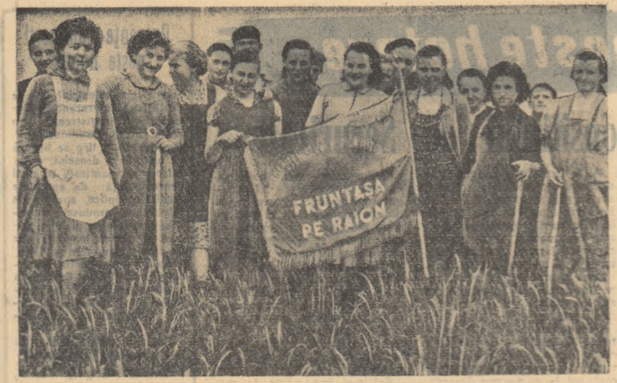
Tineri de la G.A.C. Arad, roșii Sotu Mare sînt frumoși în acțiunile de muncă patriotică.

precisă a lucrurilor. Mai mult ca oricând, anul acesta, în clasele a XI-a s-a dus și se duce o luptă susținută împotriva mediocrității. „Să nu avem nici o corijență până la examen și nici o medie sub șapte”. Acesta este lozincă a tuturor elevilor din clasele a XI-a de la Școala medie „Zoaia Kosmodemianskaia”. Pentru realizarea acestui angajament în fiecare clasă, la inițiativa birourilor U.T.M., au fost organizate grupe de instruirii, în primul rând pentru materiile cerute la examen. Acasă sau la școală se învață numai în colectiv. Elevele care stăpinesc mai bine un obiect sau altul, explică și colegelor lor, discută împreună. În ședința, s-au obținut rezultate bune. O metodă deosebit de eficientă pentru combaterea notelor slabe și a adunării notelor slabe în ultima vreme, la clasele a XI-a A, asomenea adunării au dat roade frumoase. De pildă, la ultima adunare fușină cu câteva săptămâni în urmă a fost discu-