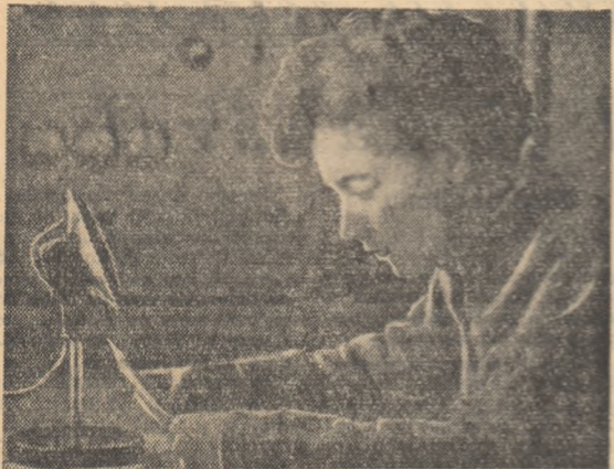
La stația de radioamplificare.