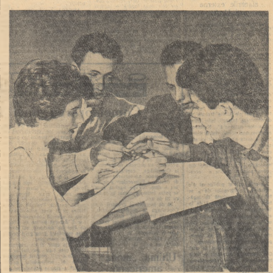
Un grup de studenți din anul III de la Facultatea de mecanizare a agriculturii din Craiova pregătindu-se în vederea examenelor.