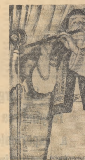
Spectacolele artiștilor amatori sînt înfloritoare întotdeauna cu bucurie de constructorii Hidrocentralei „V. I. Lenin”

caracterul contradictoriu al acestui personaj care apare adesea în postura de egoist și înghimfat. Regizorul mi-a explicat că la orice personaj trebuie să căuțăm ceea ce este esențialul, mesajul care-l transmite autorul prin intermediul personajului și mi-a arătat că, în cluda defectelor lui, Valeriu este în fond un om cîstît, un muncitor bun și de aceea el se transformă în bine pe parcursul piesei.