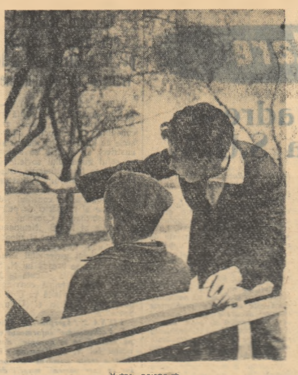
Vizitor: paisajist.