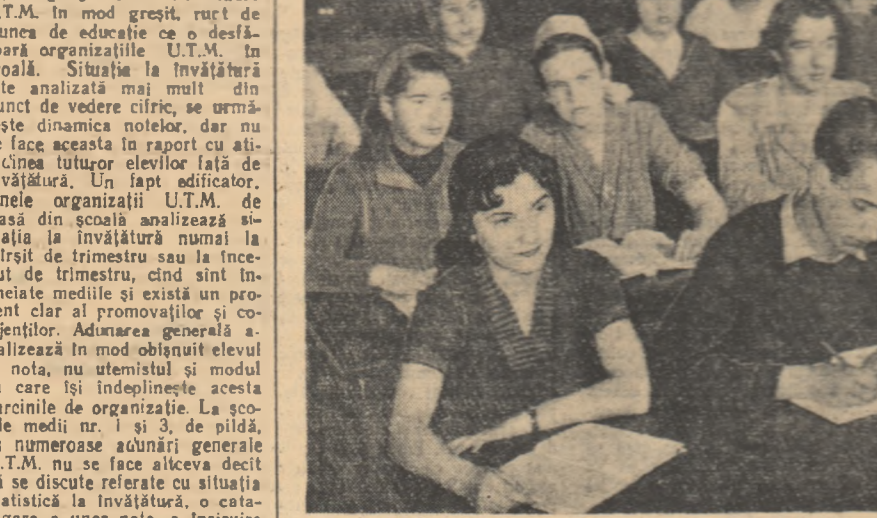
Un grup de tineri de la F.C. „Gheorghe Gheorghiu-Dej” din Capitală la cursul de minim tehnic.