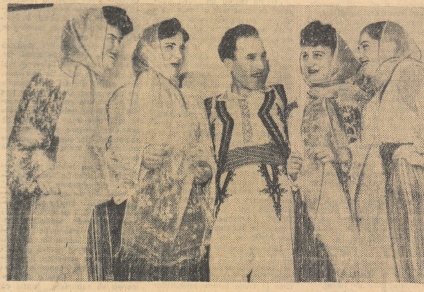
Un grup de tineri dansatori de la Școala populară de artă din Arad.