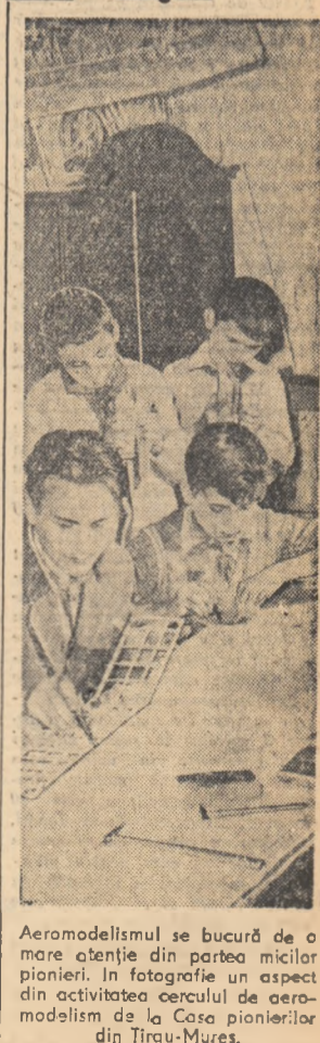
Aeromodelismul se bucură de o mare atenție din partea micilor pionieri. În fotografie un aspect din activitatea cercului de aeromodelism de la Casa pionierilor din Tirgu-Mureș.