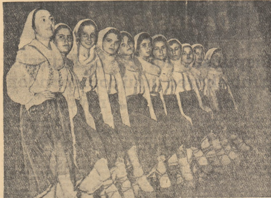
Formația de dansuri a Școlii de meserii din Pitești pregădește în cinstea celui de-al III-lea Congres al Partidului, o suită de dansuri din Muscel

★ Anul acesta titlul de campionă a Italiei la fotbal a revenit echipei Juventus Torino care a totalizat 55 puncte din 34 meciuri. Echipa Juventus cîștigă pentru a 11-a oară campionatul țării. Pe locul doi s-a clasat Fiorentina cu 47 puncte, iar pe locul trei A. S. Milan, campioana de anul trecut, cu 44 puncte.