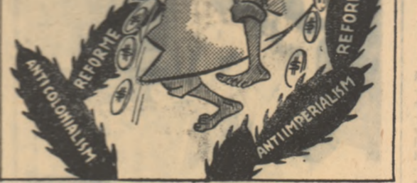
— Oaf! Căile mele devin impracticabile. (de V. TIMOC)