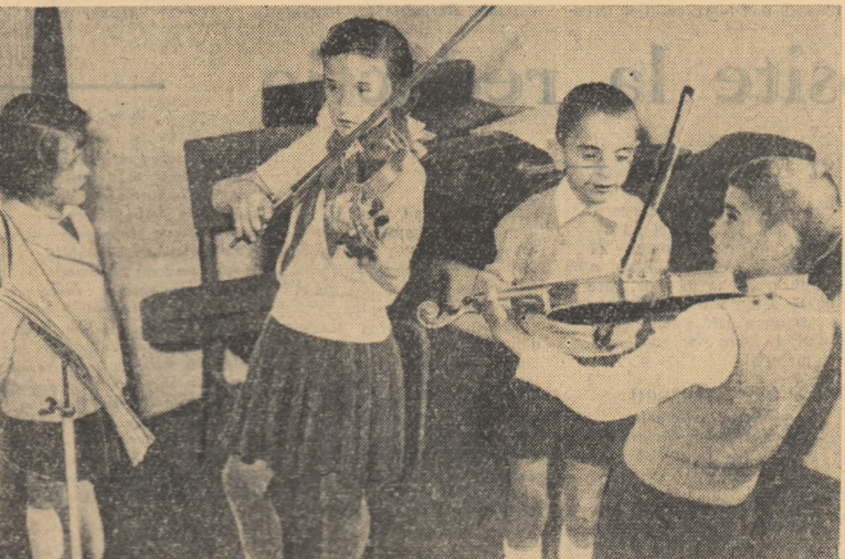
Studiu la clasa de violă. În fotografie elevii al școlii elementare de muzică din Galați.