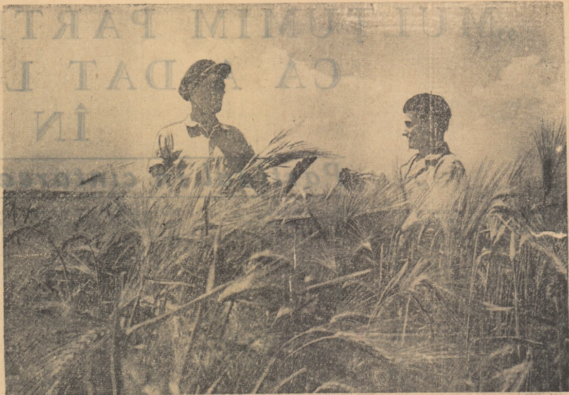
Lanurile de orz ale G.A.S. Popești-Leordeni sînt bogate în spic. După calcule această cultură va da în medie o producție de circa 3000 kg. boabe la hectar.