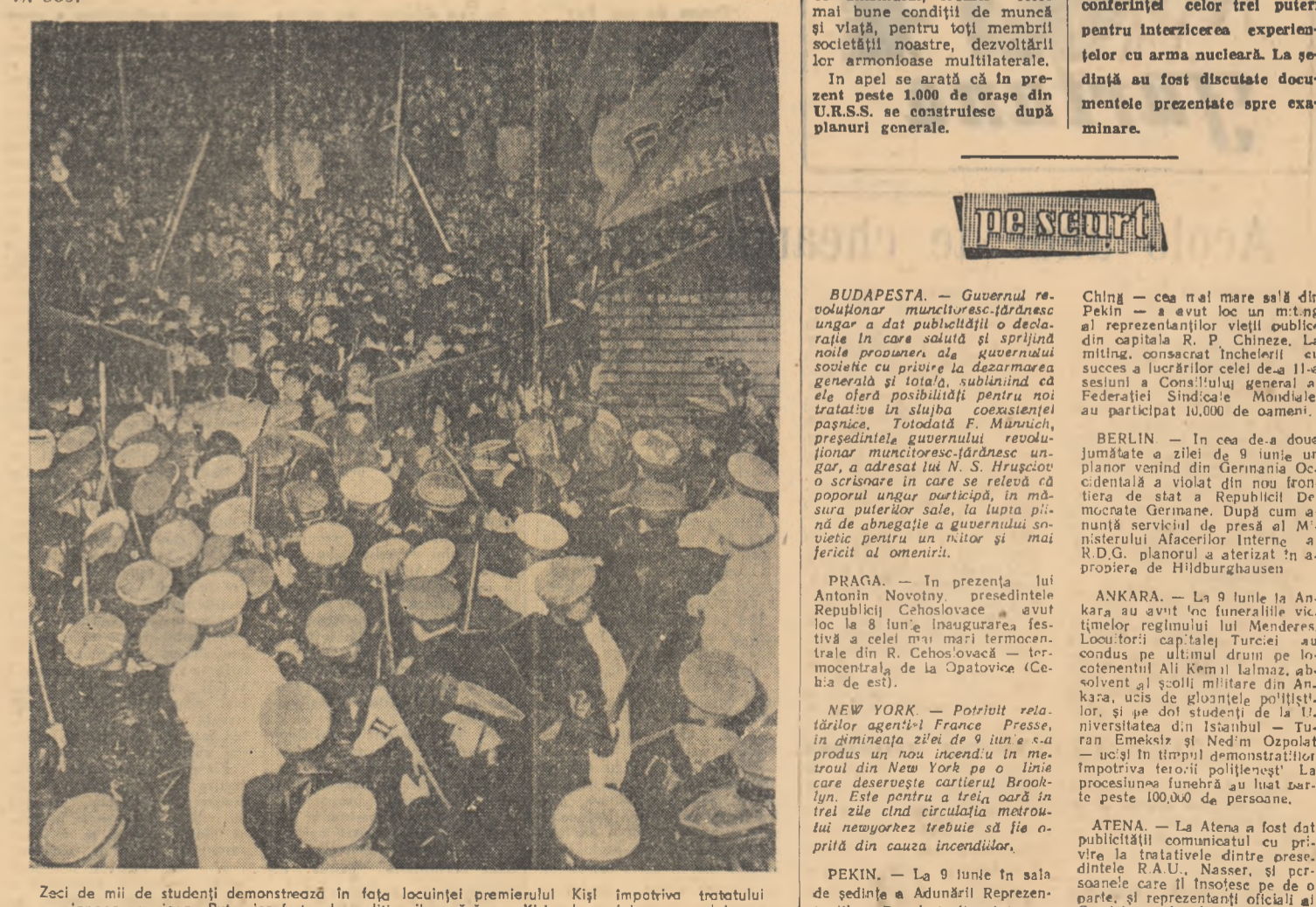
Zeci de mii de studenți demonstrează în fața locuinței premierului Kiși împotriva tratatului japono-american. Puternice forțe de poliție îl apără pe Kiși împotriva poporului.

În apel se arată că în anul puterilor sovietice orașele s-au dezvoltat în U.R.S.S. în ritm rapid. În această perioadă de