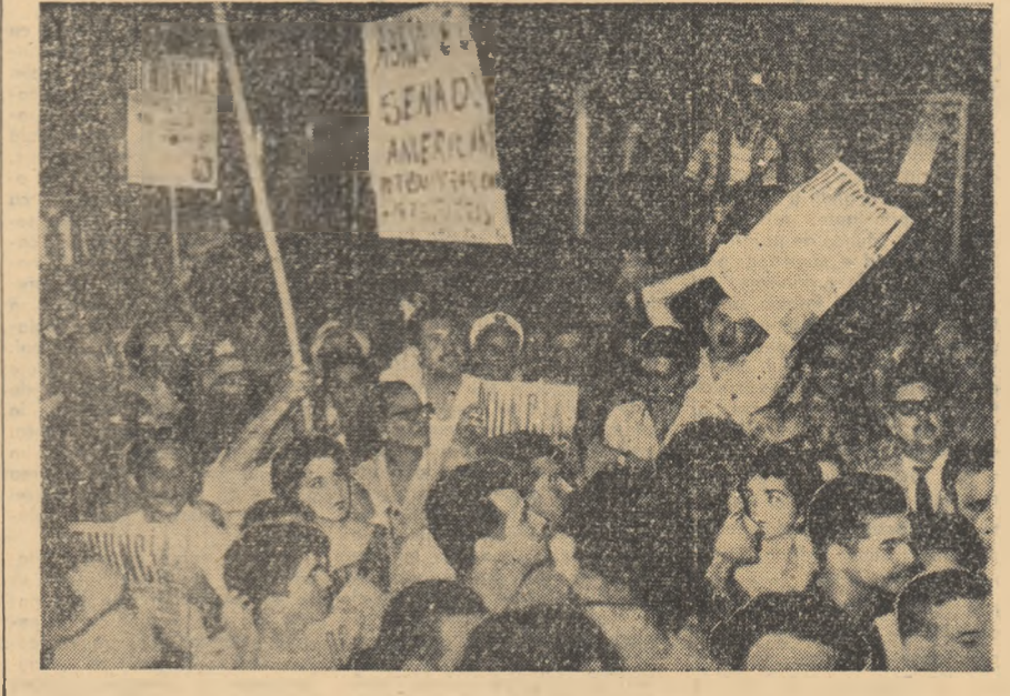
Manifestație populară la Havana în fața ambasadelor americane, împotriva politicilor agresive a S.U.A. față de Cuba.

MOSCOVA — La 11 iunie cunoscutul fruntaș al vieții publice din Grecia lider al partidului liberal S. Venizelos, a făcut o vizită lui Frol Kozlov membru al Prezidiului Comitetului Central al P.C.U.S., secretar al C.C. al P.C.U.S., cu care a avut o convorbire.