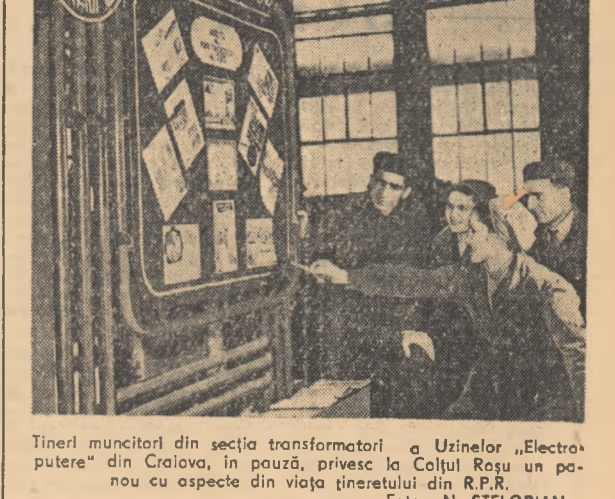
Tinerii muncitori din secția transformării a Uzinelor „Electroputere” din Craiova, în pauză, privește la Colțul Rosu un panou cu aspecte din viața tineretului din R.P.R.

Răspundînd la această chestiune trebuie să avem în vedere că activitatea unui ilegalist în trecut era în cea mai mare măsură o activitate cotidiană, obișnuită pentru un luptător comunist. Dar tocmai această activitate cotidiană cerea o mare mare încercare. Pentru ca Partidul Comunist să poată împlini misiunea istorică de conducător al maselor muncitoare trebuia desfășurată o eroică activitate cu totul anonimă. Trebuia să fie redactate, tipărite și împărtășite materialele ilegale prin care chemările partidului să ajungă la oamenii muncii, trebuia să fie dusă și de propagandă de la om la om, trebuia să fie ț-