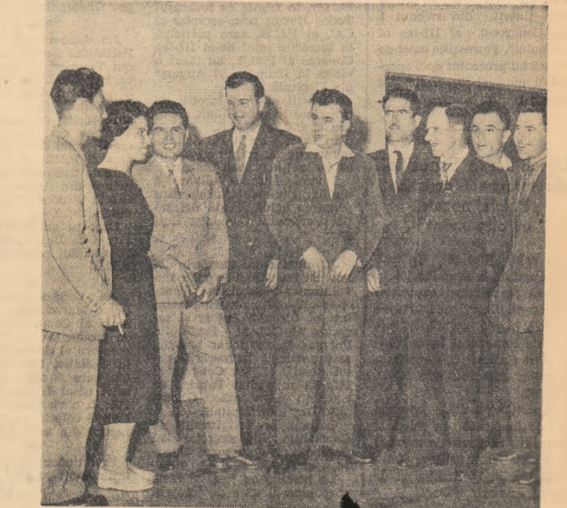
Un grup de delegați, într-o pauză a lucrărilor Congresului

De o mare însemnată pentru întărirea legăturilor partidului cu masele este rezolvarea de către organele și organizațiile