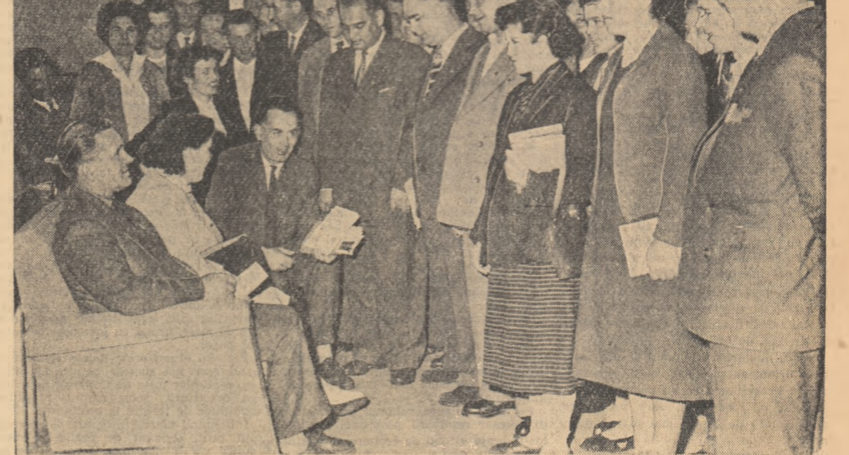
Intr-o pauză o lucrărilor Congresului

logia noastră marxist-leninistă. Această unitate asigură succesul final al luptei noastre comune. Trăiască internaționalismul proletar! (Aplauze puternice). Trăiască Partidul Muncitoresc Român! (Aplauze puternice). Trăiască pacea în lume! (Aplauze puternice). al dv. frătesc, Comitetul Politic al Partidului Comunist din Noua Zeelandă V. S. WILCOX Secretar general (Aplauze puternice, prelungite).