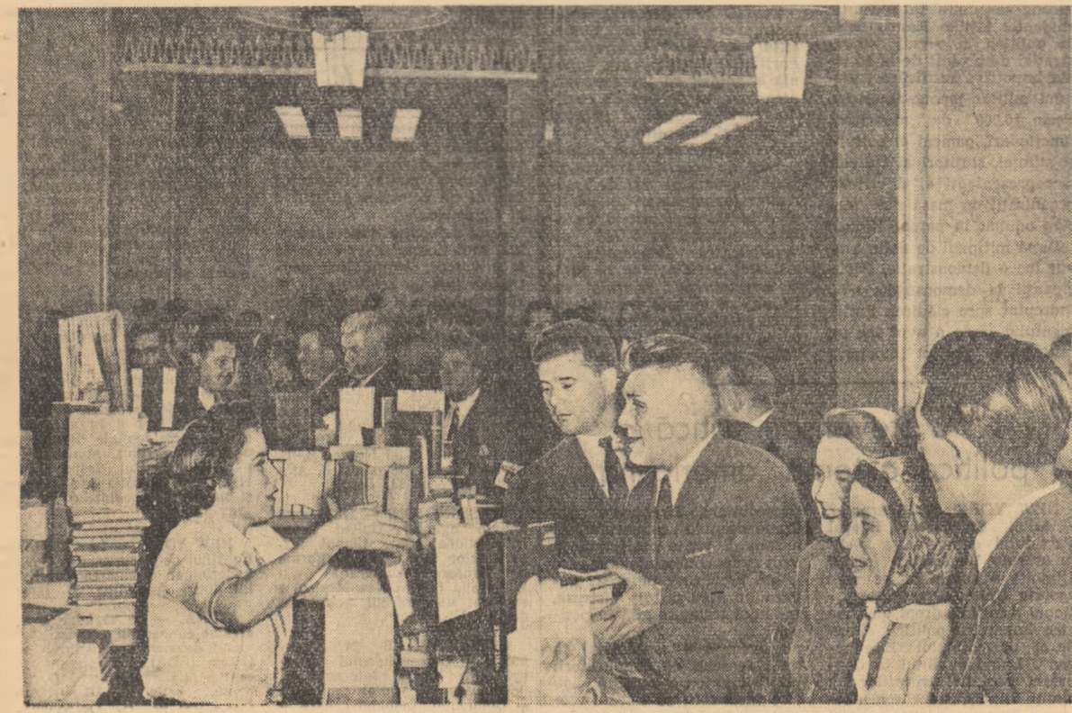
În pauze, delegaţii la Congres cercetează cu interes ştandul de cărţi.

După ce a arătat contribuţia ţării noastre la lupta pentru pace şi faptul că poporul indian apreciază profund ajutorul dat de R.P.R. Indiei pentru valorificarea bogăţiilor ei petrolifere, vorbitorul s-a referit la unele aspecte ale luptei Partidului Comunist din India. El a spus: Călăzindu-ne după învăţătura marxist-