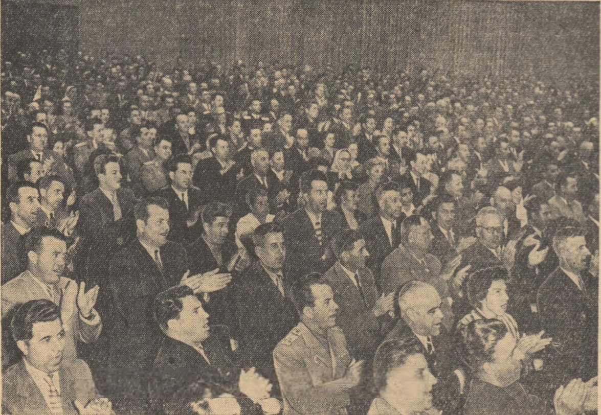
În sala Congresului

hotărîrilor Congresului, pentru desăvîrșirea construcției socialismului în patria noastră. Următoarea sedință a Congresului va avea loc la 25 iunie ora 8.30.