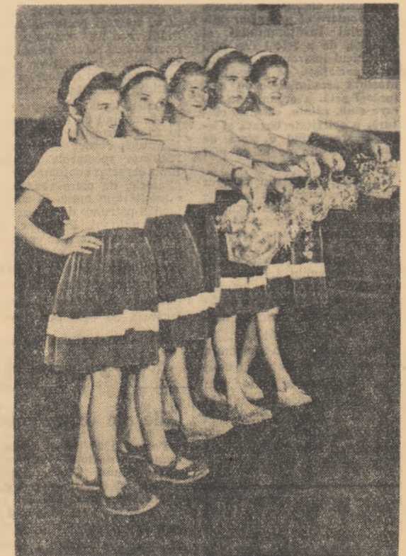
Un grup de copii din Tg. Frumos executînd un dans.