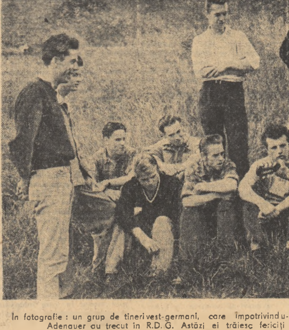
In fotografie: un grup de tineri vest-germani, care împotriva u-se politici militariste a lui Adenauer au trecut în R.D.G. Astăzi ei trăiesc fericiți în R. D. Germană.

În încheiere cancelarul J. Raab a toastat pentru bunăstarea poporului Uniunii Republicilor Sovietice Socialiste, în sănătatea primului ministru sovietic, a soției lui și pentru permanente relații bune și prietenești între cele două state.