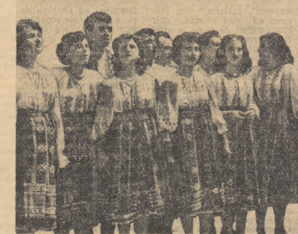
Brigada artistică de agitație de pe lângă Casa de cultură din Cărbășii în timpul unui spectacol.

Operativitatea, orientarea la specificul locului, combativitatea și caracterul concret și documentat, sînt alte calități pe care trebuie să le îndeplinească brigada științifică. Pentru aceasta o datorie principală, demonstrată de majoritatea membrilor brigăzii științifice deplasată în comuna Prejmer, este aceea de a cunoaște din timp viața comunei, frîmintările tineretului, fapte și exemple din viața lui de toate zilele.