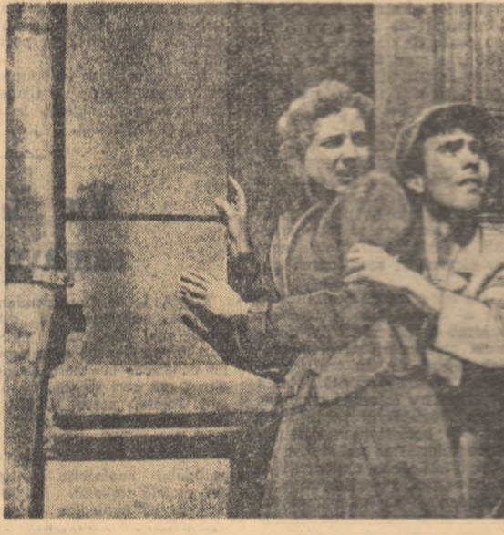
O scenă din film