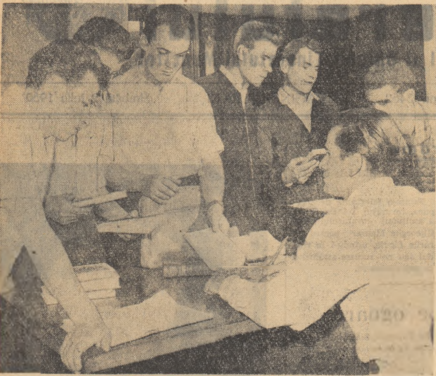
Un grup de tineri tineri de la Uzinele „Mo Te-dun” împrumutând cărți de la bibliotecă.