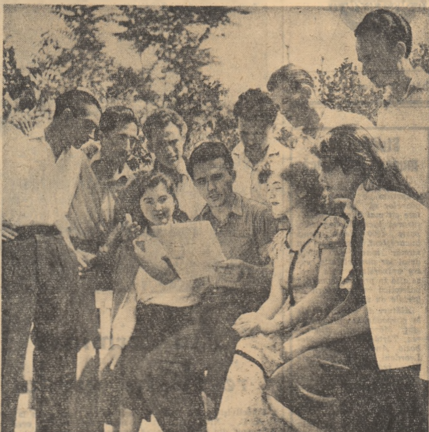
Un grup de tineri muncitori și muncitoare de la fabrica „I. C. Frimu” din Craiova învățând în comun poezii închinată partidului.