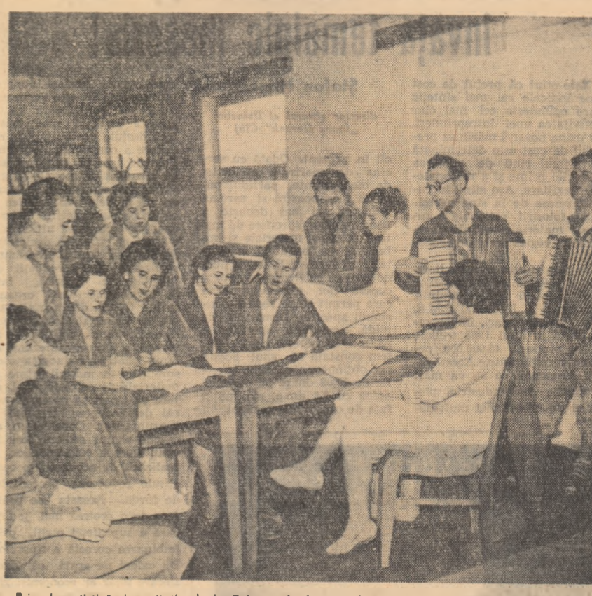
Brigada artistică de agitație de la Fabrica de falanță din Sighișoara, pregătește un nou spectacol.

suri, fragmente literare, cîntec. Clubul C.F.R. din Arad l-a avut ca oaspete la o reuniune recentă pe tinerii poeți din cercul literar „Al Sahla” care au recitat din creațiile lor închinată partidului. La „Decorativă”, la centrul mecanic, comuniștii au vorbit tinerilor despre anii grei de luptă pentru eliberarea țării. La Rusea, la două școli din Timișoara s-au ținut carnete de U.T.M. la patru fosta pionieri la mormîntul lui Lazăr Cernescu. Cultivarea cunoștințelor despre drumul glorios de luptă al partidului cere foarte mult, în această privință, organizatorilor joilor ori duminicilor tineretului. Experiența organelor și organizațiilor U.T.M. din regiunea Timișoara dovedește că preocuparea stăruitoare, munca cu un număr mare de tineri dă rezultate din cele mai bune. La joia tineretului, tinerii vin cu bucurie — aceasta arată reușita. Viața culturală a tineretului