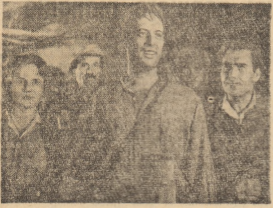
lată în fotografia din stînga e imagine din filmul „Comandan-tul detașamentului” o producție a studiourilor Bulgare. Fotografia din dreapta redă o scenă din filmul „Scrisoarea Elvirei”, producție a studiourilor cinematografice sovietice.