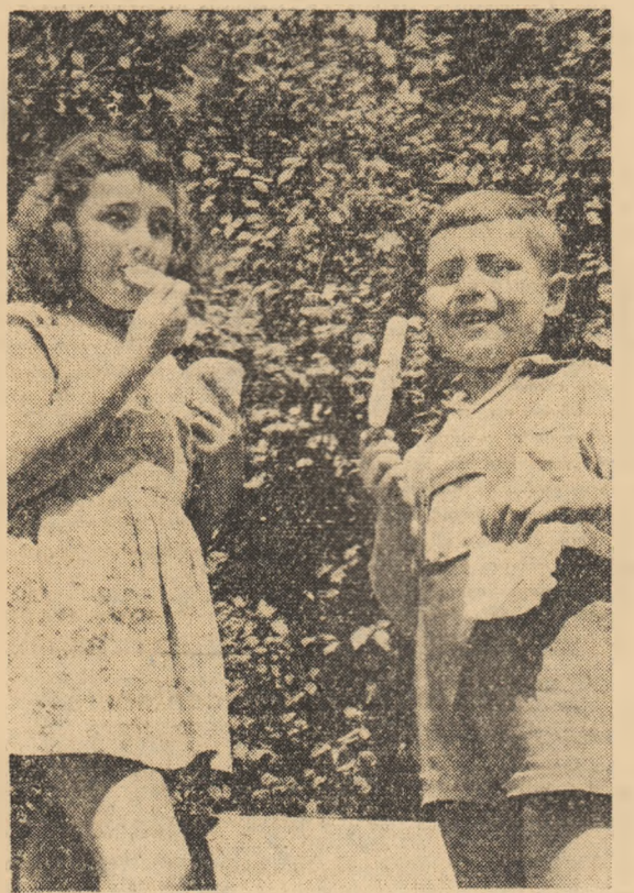
E bună înghețata

CLUI (de la corespondențul nostru). Comitetul raional U.T.M. Nășud a organizat recent o săptămîna de muncii patriotice. Obiectivele acestei acțiuni au fost colectarea șierului vechi, înfrumusețarea satelor și întreținerea pașunilor și a culturilor. În această săptămîna, la acțiunile de muncă patriotică, alături de organizațiile de bază U.T.M. au participat și unitățile de pionieri. În această perioadă brigăzile utemiste de muncă patriotică din raional Nășud au executat lucrări de curățire a mărăcinilor, distrugerea spinișorilor și împărșierea musuroaielor pe o suprafață de 340 hectare pășune. Tot în această perioadă s-a colectat o cantitate de 56 tone fier vechi și au fost efectuate peste 9.600 ore muncă patriotică la întreținerea culturilor realizînd economii în valoare de peste 20.000 lei.