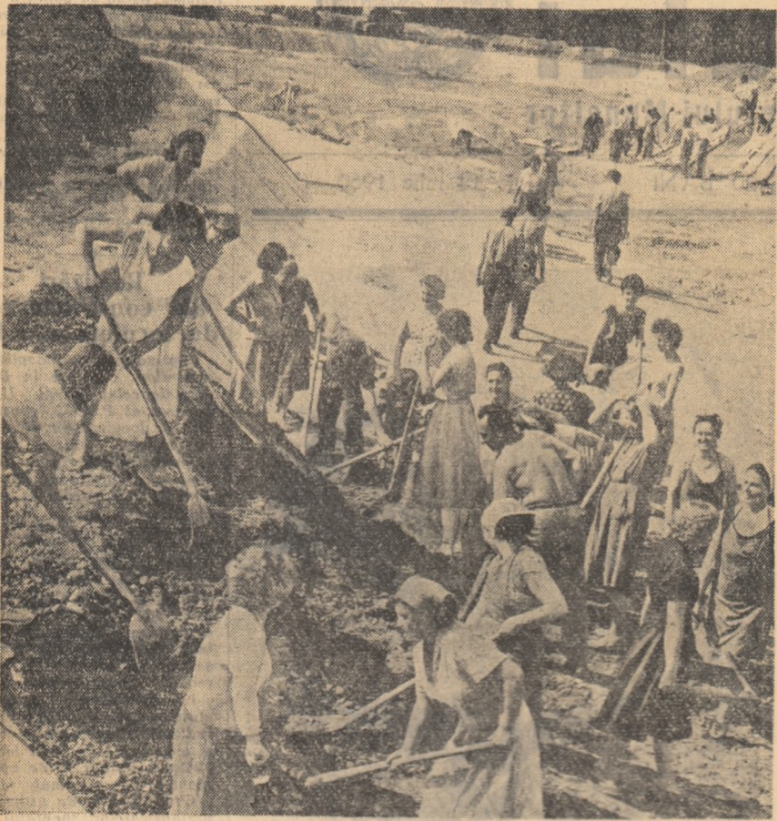
Nenumărați tineri timișoreni participă cu entuziasm la muncă patriotică pentru construirea unui mare strand de la marginea orașului.

Pământurile acestea bătrâne, culcate la poalele munților Carpați, dobândesc marea a frumusețe nouă. Omul lucrează asupra naturii: aruncă peria verde a pădurilor peste colinele goale, își taie drum apelor, le stăvilește dincolo, înfloreste grădini și desfășoară panglicile canușii ale șoselelor din zăre în zăre, printr-o două șiruri de plopi. O parte din toate aceste prefaceri se datoresc și muncii noastre patriotice. Adu-ți aminte de un sat pe care l-ai știut cândva și du-te să-l revezi. La marginea satului, ai să te oprești, nerecunoscând locurile: acolo e un teren sportiv; cînd s-a ivit? În centru neopărât ai să vizitezi noile apartări edilitare, în căpături cămin cultural, luminosa școală, abul dispensar medical. Cine le-a ridicat? Cine a curățat izvoarele, cine a pietruit drumurile, cine a înfundat în pământ stâlpii de susținere a rețelei electrice? Entuziasmul apocliptic nostru trede în sute de mil de ore de efort colectiv și volunțar. Munca noastră patriotică. Cunoști strada aceasta din orașul în