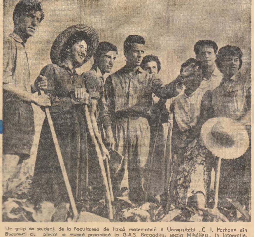
Un grup de studenți de la Facultatea de fizică matematică a Universității „C. I. Parhon” din București au plecat la muncă patriotică la G.A.S. Bregodina, secta Mihăilești. În fotografie, inginerul șantierului Viaductului studenții lucrărilor pe care le vor face.