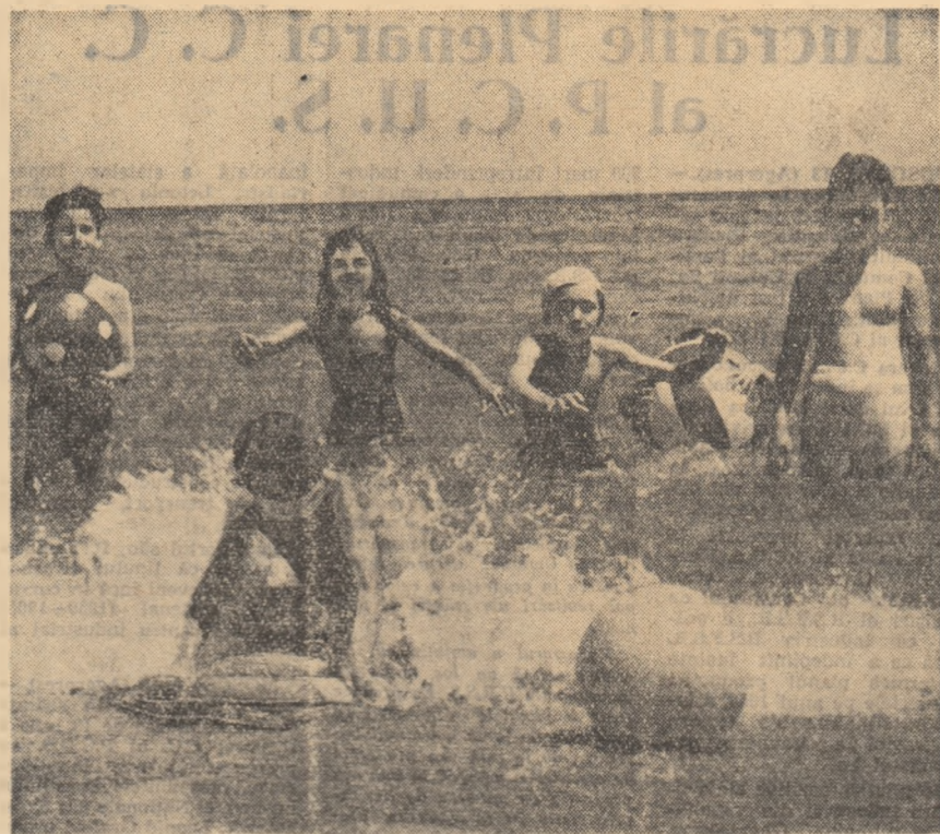
Copiii petrec o vacanță plăcută pe litoralul Mării Negre.