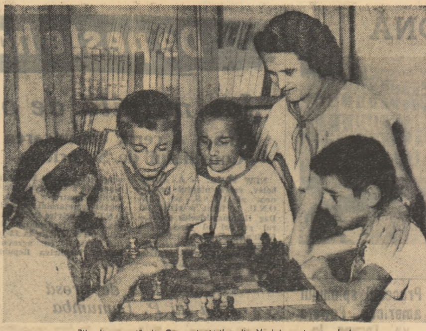
Zile de vacanță, la Casa pionierilor din Vaslui, regiunea Iași.