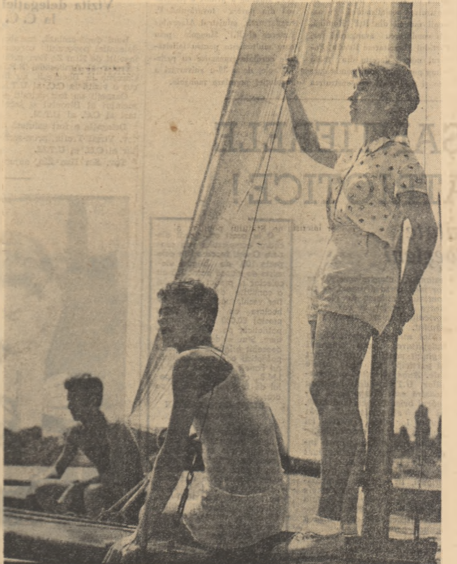
Vînt bun! Iola o porni în larg să brăzdeze apele ca de argint ale lacului.

deplasării unui stol de păsări pornit în migrație. În primul rînd sentimentul colectivității, în zorii zilei, din toate stră-șărușii orașului sosesc la punc-