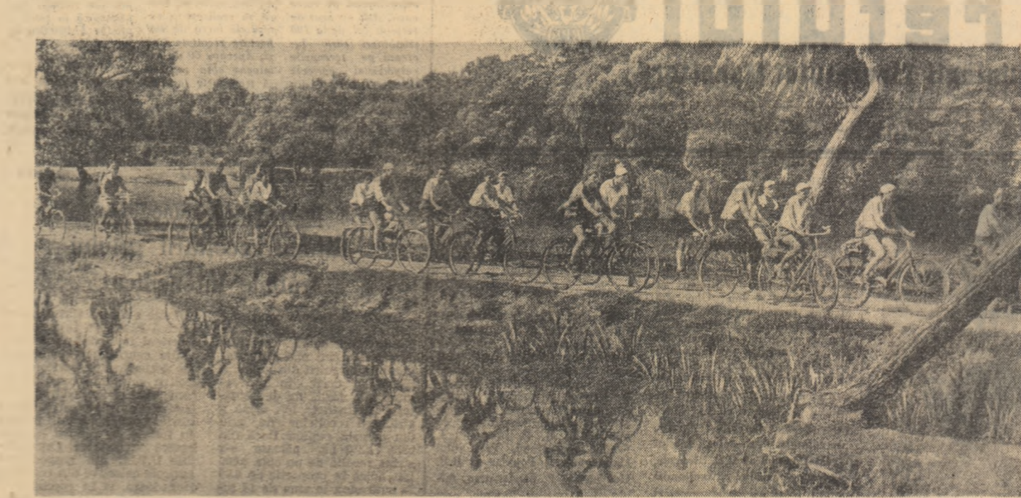
Kilometru de kilometru, ciclistul își înfășoară în calea lor imagini noi din frumusețea de neasemuit a patriei.

Precizare: nu bucuriile unei veri la general, ci a verii 1960. Cu tot ce posedă ea ca avere a poporului și omnia în întregime lui. Cu banii de câștig și bani ascuți; cu stoli sportive de mare; cu cuburi și scurtoare bine la-astrate. Măuta, vîntule mîi-lose, stau la dispoziția no-