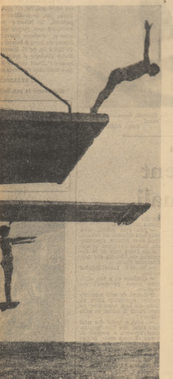
Curașărușii, îndemînărușii, și, evident poșărușii pentru ...batînușărușii de inot.