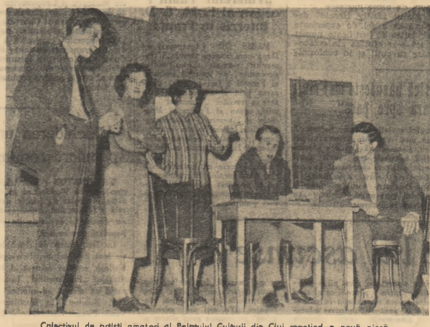
Colectiv de artiști amatori al Palatului Culturii din Cluj repedînd o nouă piesă.

țată în rândurile tinerilor țărani muncitori, așa cum ne cere partidul. Proiecte, planuri îndrăznețe de viitor, siguranța deplină că ele se vor îndeplini în cel mai scurt timp. Mi-am amintit, prin contrast, privind aceste chipuri tinere, încrezătoare, de Nicolae Apostol, dascălul din romanul lui Cezar Petrescu. Și-am simțit o mîndrie nespūsă, o bucurie fără mîngîiri, atînd cu siguranță că nici unul din cei aproape 1700 de absolvenți ai universităților noastre, care pleacă în aceste zile să-și ia catedra în primărie, în orice colț de țară se va duce nu va împărțiși soarta. Nici unul din cărțile acesteia minunate corăbii ale lumii care a pornit în larg, cu toate pinzele sale, nu se va clătina. Și aceasta pentru că e cineva care veghează neobosit ca viața să fie frumoasă peste tot, un soare viu care ne luminează mintea și inima ducîndu-ne mereu spre izbîndă — partidul. Urăm din inimă spor la munca celor mai tineri intelectuali ai patriei, care au pășit în viață odată cu primele realizări mărețe ale secolului!