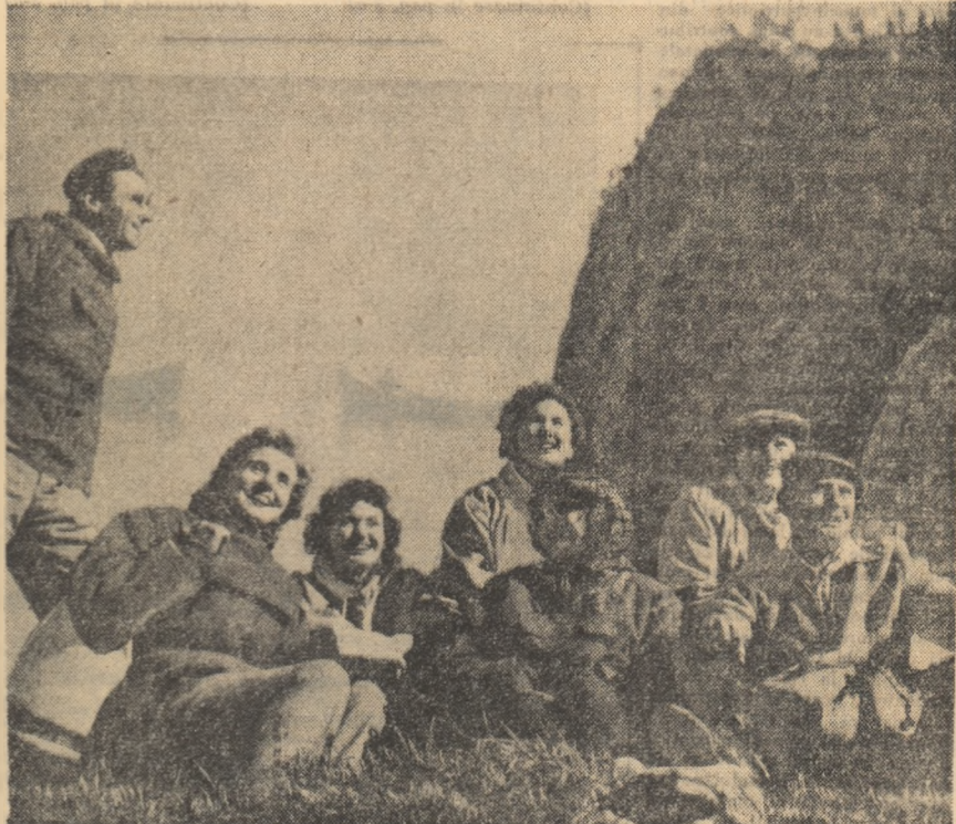
Într-un scurt popos, bucuria pe care li-o dă cucerirea înălțimilor, stăpînește inimile temerariilor excursionișărușii.

tul stabilit, rînd pe rînd, ci-clisșărușii amatori, călărînd pe toate tipurile posibile - dar între care predomină ale noa-șărușii, „Victoria” și „Carpați”.