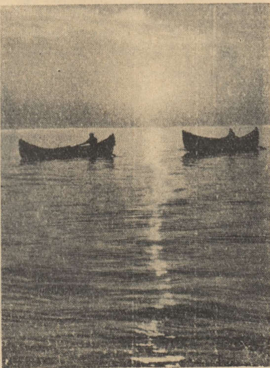
Amurg în Delta