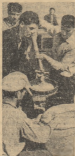
La baza de recepție din orașul Sibobazia, regiunea București, cu începutul sezonului de lucru, de aparate electrice noi, să discute cum anume ar putea aplica și ei procedee sau metode noi de muncă. Unii tineri au făcut chiar propuneri concrete, ce așsemnează cu cunoștințele și aprofundarea mai bine! Pe baza informațiilor și răspunsurilor adunate de la tineri, inginerii au alcătuit apoi o tematică bogată și interesantă, au împărțit-o în mai multe lecții. Cu prilejul expunerii lor se fac demonstrații practice, sînt folosite scheme, planșe, tablouri. Și toate acestea îi determină pe tineri să participe cu viu interes.