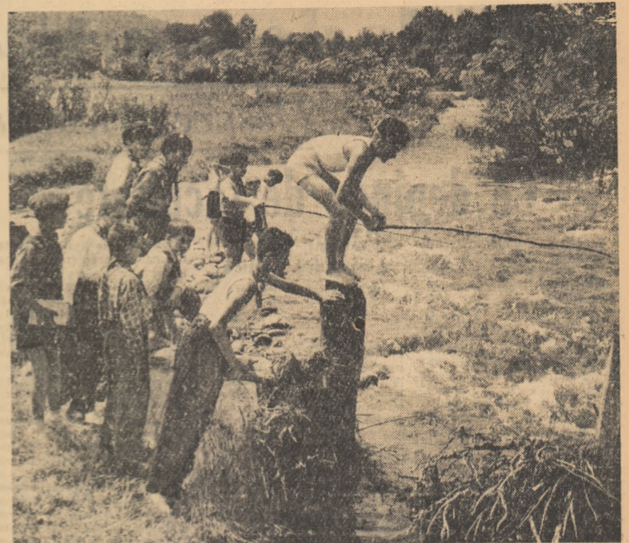
„Și printre pionierii din tabăra de la Săcel — raionul Hațeg se găsesc mulți pescari amatori.

Zilele de practică — zile de învățatură intensă!