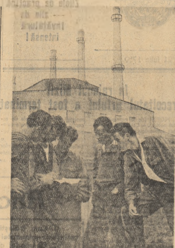
Ce am învățat azi? Iată ce vor să precizeze studenții timișoreni după orele de practică la C. S. Hunedoara.

Un plan comun de activități culturale - educative