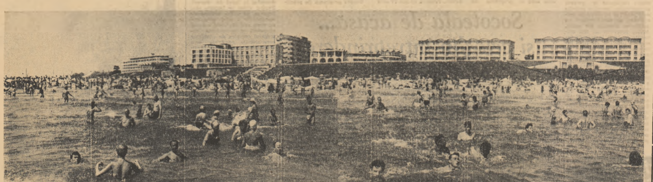
La Mangalia, pe plajă.