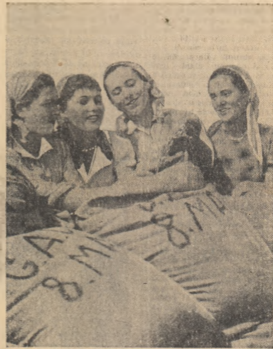
— Frumoașă recoltă! — Și ce curat e grîul nostru! O discuție obîsnuită la sfîrșitul unei zile de companie între cîteva fete din gospodăria colectivă „8 Mai” din comuna Produleni, regiunea București.