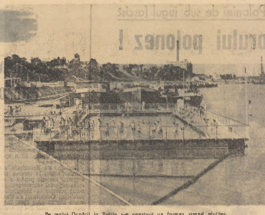
Pe malul Dunării la Braila s-a construit un frumos strand plititor.