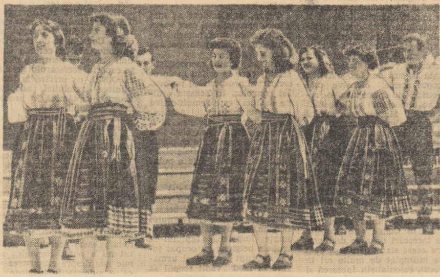
Echipa de dansuri a Casei de cultură din Colărași.

Au fost prezentate șase comunicări științifice privind sarcinile științifice juridice în lumina Documentelor celui de-al III-lea Congres al P.M.R.